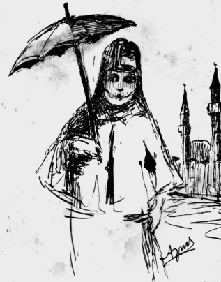
“Ο ΚΟΡΑΗΣ” 1929

επιχειρεί με πολύ προσωπικό μόχθο και οικονομικό κόστος να την κάνει πράξη μέσω του Εθνολογικού Μουσείου Θράκης. Κατά την ειλικρινή προσπάθειά της το Μουσείο να μετατραπεί σε ζωντανό οργανισμό έρευνας του πολιτισμού της Θράκης, από τον Μάιο του 2013 η γνωριμία μας και η φιλία μας λαμβάνει τη μορφή στενής συνεργασίας. Έπειτα από εισήγησή της και απόφαση του διοικητικού συμβουλίου, σχηματίζεται ερευνητικό τμήμα του Εθνολογικού Μουσείου Θράκης με την επωνυμία «Αρχείο Θρακικής Λογοτεχνίας», την επιστημονική διεύθυνση του οποίου αναλαμβάνω. Το «Αρχείο Θρακικής Λογοτεχνίας» στοχεύει στη συλλογή, κατάταξη, μελέτη και έκδοση αρχειακού, έντυπου και ψηφιακού υλικού για τη διάσωση της θρακικής λογοτεχνίας και γραμματείας, κυρίως του 19 ου αιώνα, και την προαγωγή της φιλολογικής επιστήμης με επίκεντρο τον ενιαίο θρακικό χώρο 3 . Βασικό μέλημά του είναι η συγκέντρωση και η έρευνα αρχείων, αυτοτελών εκδόσεων, εφημερίδων και περιοδικών του εξωελλαδικού ελληνισμού (ιδίως της Κωνσταντινούπολης και της Σμύρνης) του 19 ου και των αρχών του 20 ου αιώνα με θρακικού περιεχομένου ύλη.