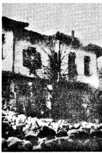
Η αφίσα και το εξώφυλλο της έκδοσης και πάνω και πάνω το σπίτι του συγγραφέα