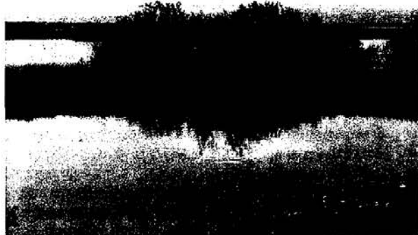
Ο ποταμός Έβρος.

..... το ‘ριξα στο ποτάμι μαζί με τους βατράχους τότε είναι που χάλασε τον κόσμο άρχισε κάτι παράξενα τραγούδια να τσιτζί φοβερά και να ουρλιάζει