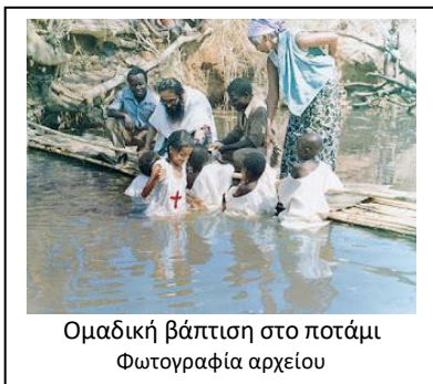
Ομαδική βάπτισή στο ποτάμι

Εκτός από τους πτωχούς και τους αρρώστους υπήρχαν και οι φυλακισμένοι. Οι περισσότεροι φυλακίζοντας για ασήμαντα πράγματα. Εκεί, εάν δεν είχαν κάποιον να τους φροντίζει το φαγητό πέθαιναν από την πείνα. Πήγαινε συχνά σ' αυτούς ο π. Κοσμάς και μας έλεγε ότι η κατάσταση τους είναι απελπιστική. Όσους φυλακίζοντας για μικροαδικήματα, πλήρωνε μερικά ποσά και τους αποφυλάκιζε. Τα κρατητήρια ήταν σε άθλια κατάσταση. Οι φυλακισμένοι πολλές φορές κοιμούνται μέσα στα νερά που μπαίνουν από τις τρύπιες οροφές. Πήγαινε με μαστόρους ο π. Κοσμάς και διόρθωνε τις σκεπές των κτιρίων. Τότε οι φυλακισμένοι χαίροντας και τον ευχαριστούσαν.