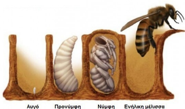
Αυγό Προνύμφη Νύμφη Ενήλικη μέλισσα

12. Τρεις (3) μικρές Μέλισσες - Κ ..... που βρίσκονται στο στάδιο της νύμφης και περιμένουν να γεννηθούν.