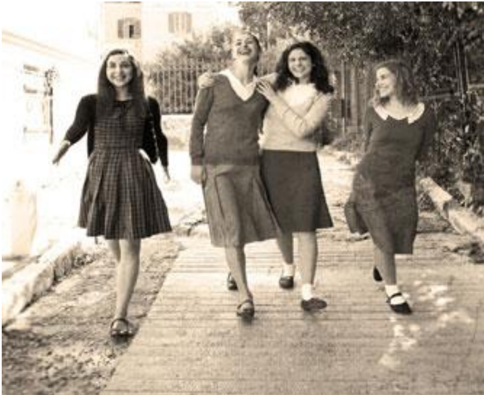
Εικόνα από παρουσίαση θεατρικής παράστασης από τον θίασο «Πεδίον Τέχνης» στο θέατρο «Τζένη Καρέζη», Οκτώβριος 2013. biblioanafores.blogspot.com/2017/07/blog-post.html