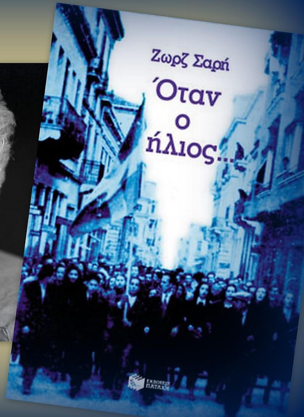
Εικόνα εξωφύλλου έκδοσης Πατάκη 2003