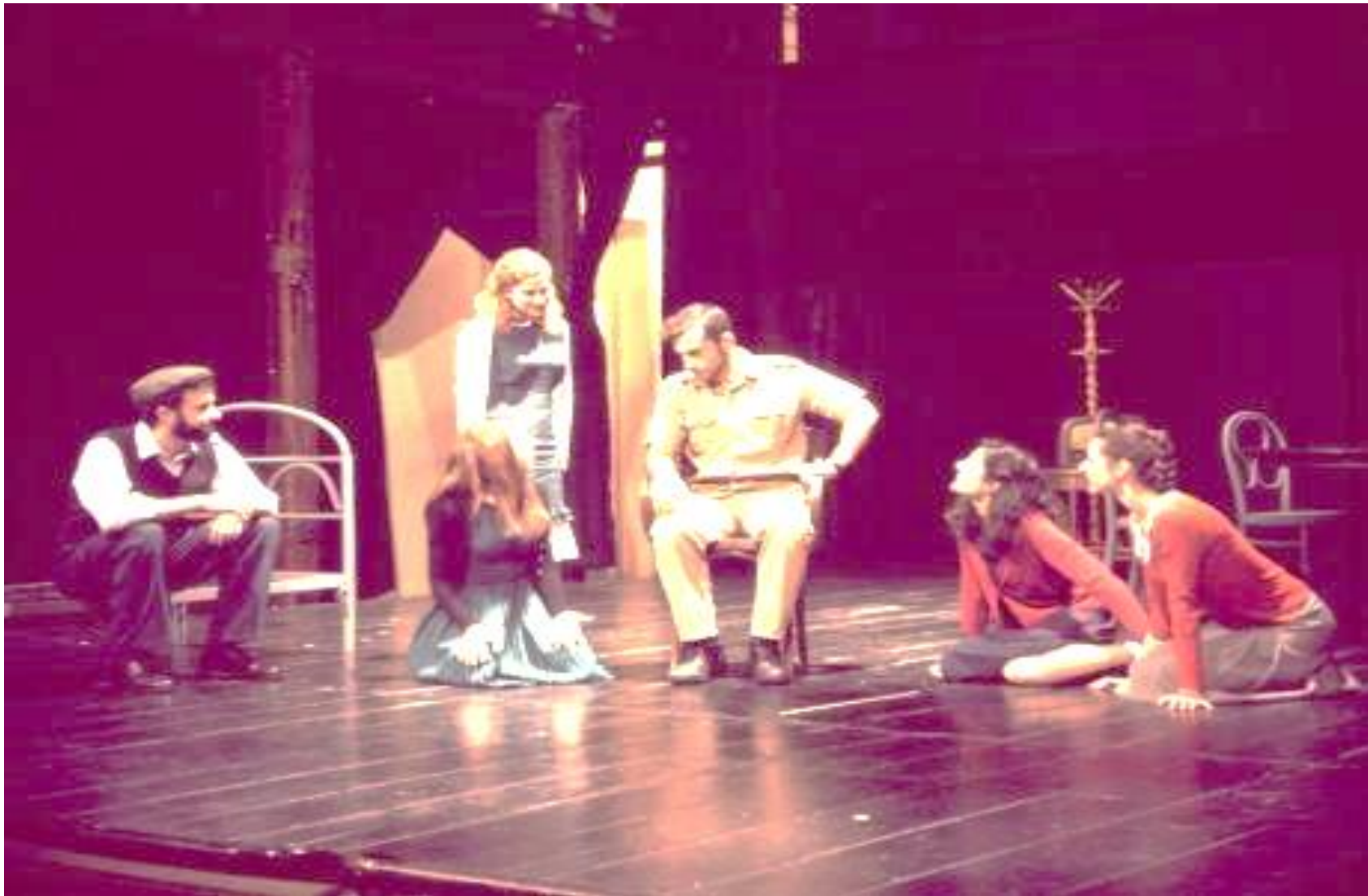
Εικόνα από πρόβες θεατρικής παράστασης από τον θίασο «Πεδίον Τέχνης», στο θέατρο «Κάρολος Κουν», Απρίλιος 2013.