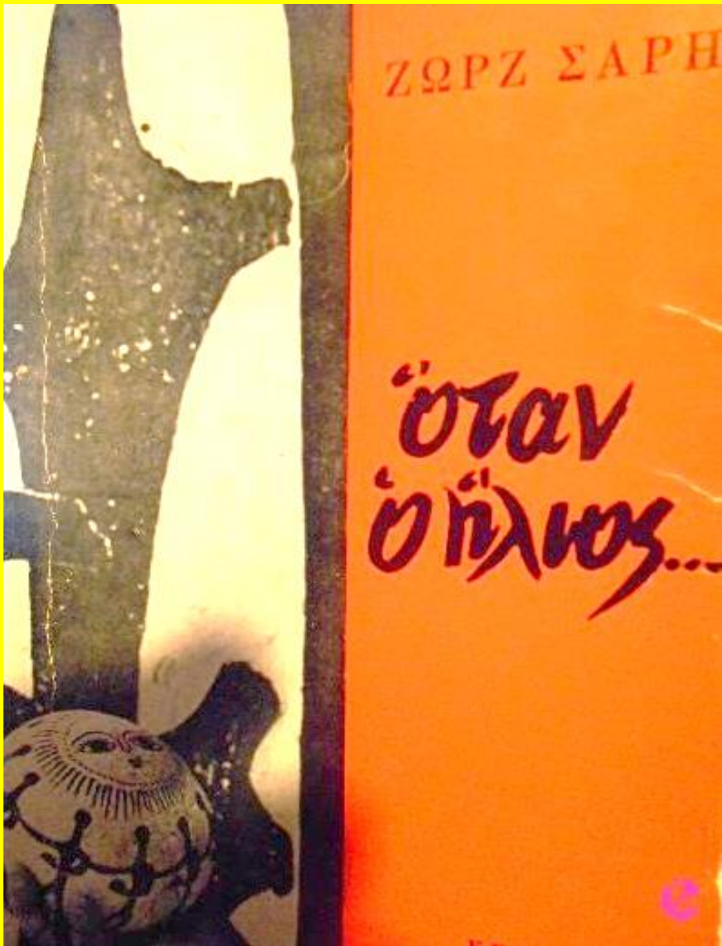
Εικόνα εξωφύλλου έκδοσης Κέδρου 1971