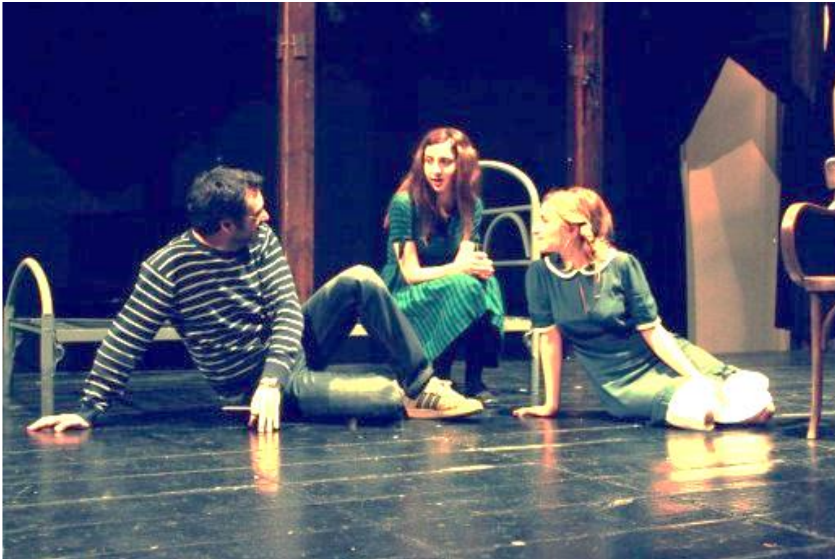
Εικόνα από πρόβες θεατρικής παράστασης από τον θίασο «Πεδίον Τέχνης», στο θέατρο «Κάρολος Κουν», Απρίλιος 2013. Bookstandfiles.wordpress.com