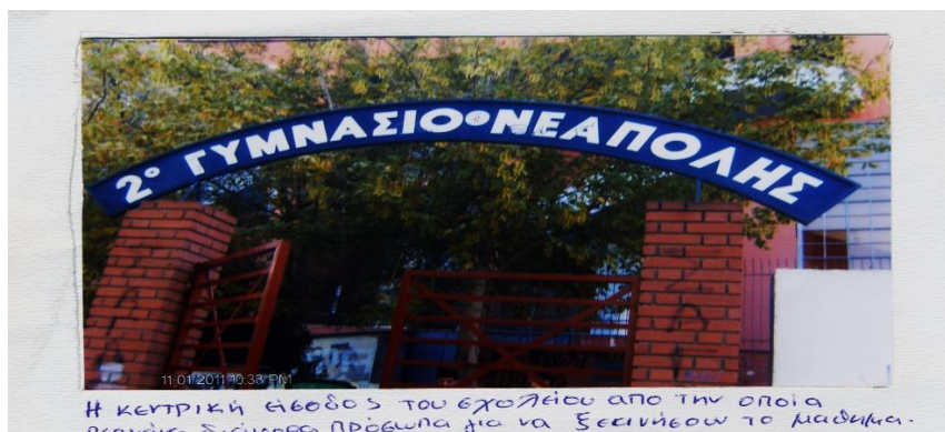
Η ΚΕΝΤΡΙΚΗ ΕΙΣΟΔΟΣ ΤΟΥ ΣΧΟΛΕΙΟΥ ΑΠΟ ΤΗΝ ΟΠΟΙΑ ΠΕΡΝΑΩ ΔΙΑΦΕΡΑ ΠΡΟΣΩΠΑ ΔΙΑ ΝΑ ΞΕΚΙΝΗΣΩ ΤΟ ΜΑΘΗΜΑ.