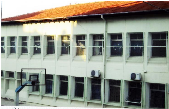
ΟΙ ΑΙΘΟΥΣΕΣ ΔΙΔΑΣΚΑΛΙΑΣ ΤΩΝ ΜΑΘΗΤΩΝ ΚΑΙ ΤΑ ΓΡΑΦΕΙΑ ΤΩΝ ΚΑΘΗΓΗΤΩΝ

Συνέχισε εσύ τώρα το κύριο μέρος, με τα 2 ειδών στοιχεία που ζητάει ο θεματικός τίτλος.... ..