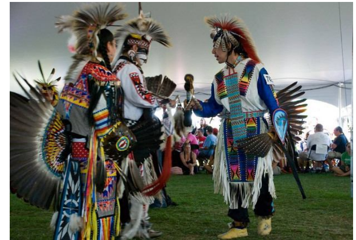
ΙΝΔΙΑΝΟΙ ΤΟΥ ΚΑΝΑΔΑ