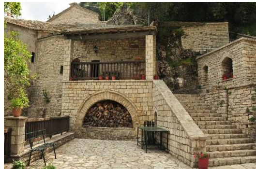
Μονή Παναγία η Πελεκητή