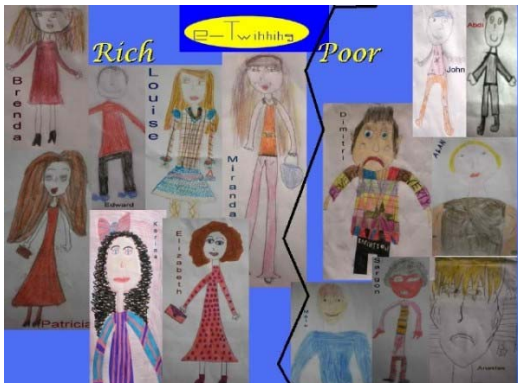
Έργο 10ου Δ. Ηλιούπολης (16 μαθητές)