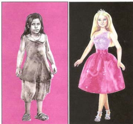
21. Χωρίς τίτλο (έκθεση Unesco)