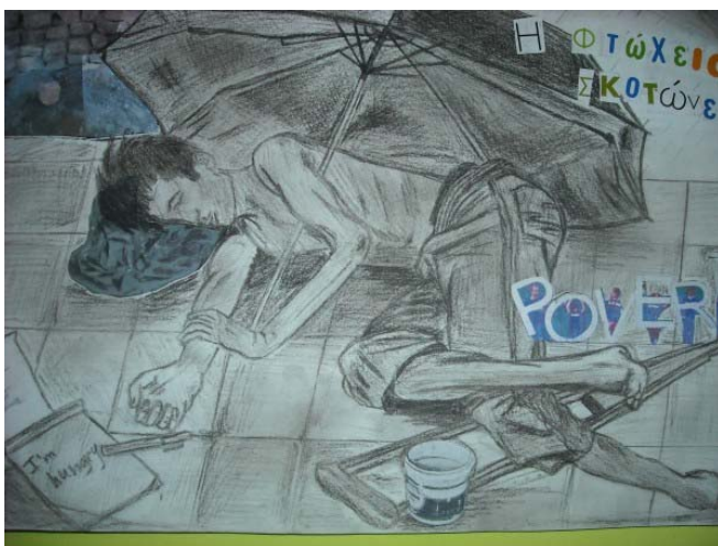
Έργο 6ου Ε.Α. Ιλίου - Μουρτίδου Ελευθ.