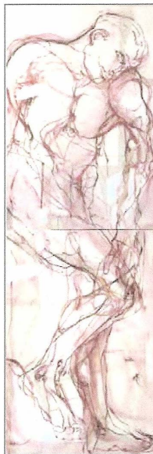
32 Πτώση (έκθεση Unesco)