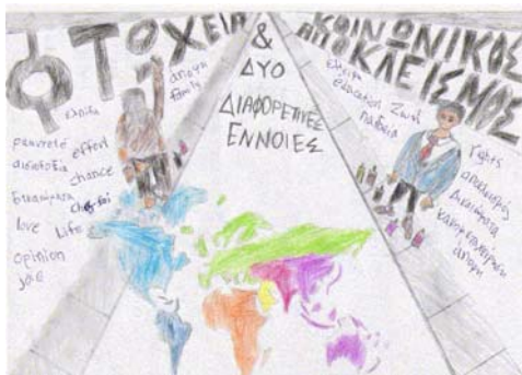
Έργο 2 ο Γ. Καισαριανής(11 μαθητές).