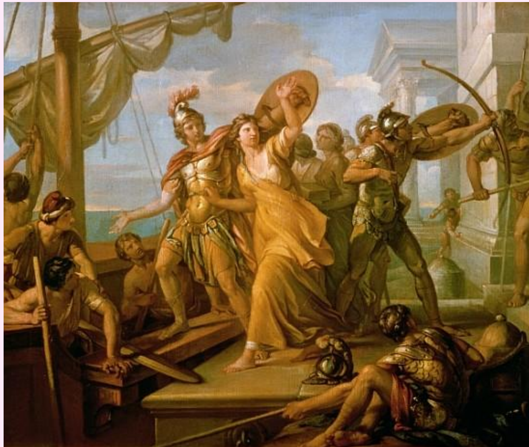
The Rape of Helen of Troy - Gavin Hamilton

Μια προσπάθεια προσέγγισης της σεφερικής μυθικής μεθόδου