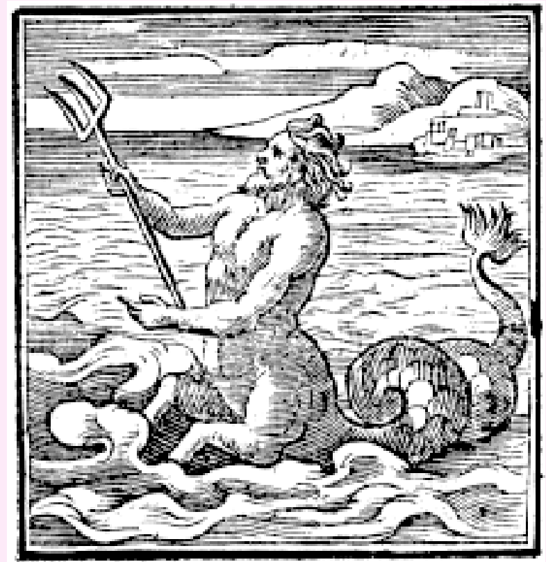
Ο Πρωτέας, ξυλογραφία, Jörg Breu