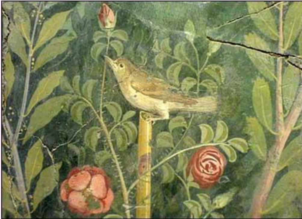
Ancient Roman paintings

Σύμφωνα με μία εκδοχή, η αηδόνα κατά λάθος σκότωσε το γιο της, τον Ίτυλο και ο Δίας, για να της απαλύνει τον πόνο, τη μεταμόρφωσε σε αηδόνη. Από τότε θρηνεί το χαμό του παιδιού της.