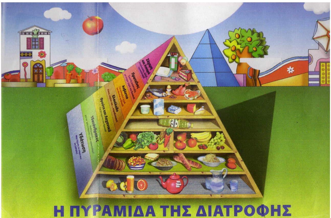
Η ΠΥΡΑΜΙΔΑ ΤΗΣ ΔΙΑΤΡΟΦΗΣ