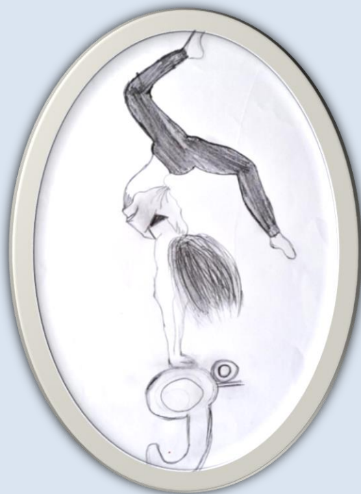
εικόνα της μαθήτριας Βάλιας Φωτοπούλου Γ4