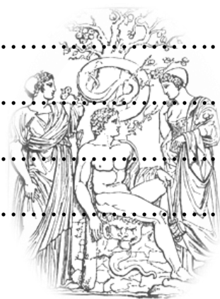
(the Hesperides. at Rome.)