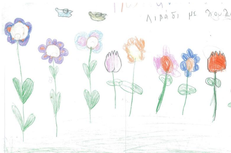
Λιβάδι με λουλούδια