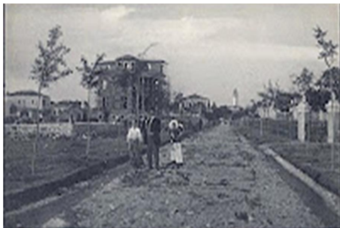
Jardin Principal et Allées, Indochine