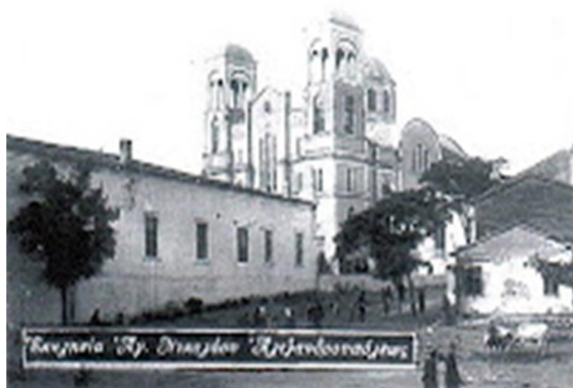
Basilica 'St. Marcos' Antigua Guatemala