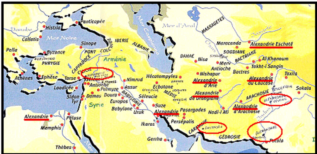
Οι Αλεξάνδρειες του Μ. Αλέξανδρου