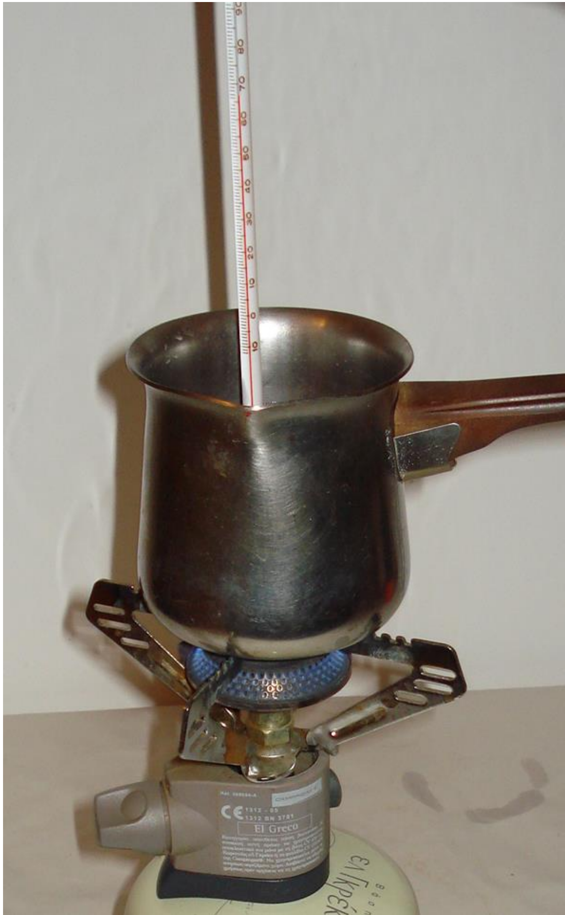
Συγγραφή: Στυλιανακάκης Γιάννης – Δάσκαλος / Συνεργάτης του ΕΚΦΕ Χανίων για την Π.Ε.