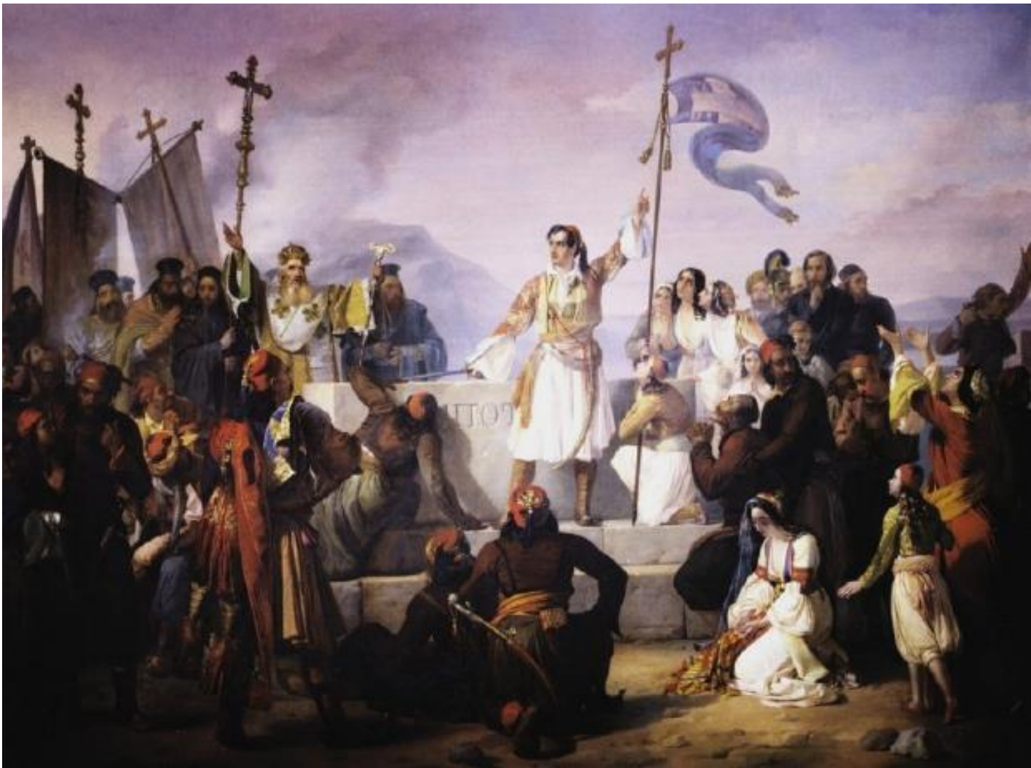
Ο όρκος του λόρδου Βύρωνα στον τάφο του Μάρκου Μπότσαρη

Μαθητής του Λιπαρίνι ήταν ο Έλληνας ζωγράφος Διονύσιος Τσόκος που επίσης αποτύπωσε σε πίνακές του στιγμές της Ελληνικής Επανάστασης.