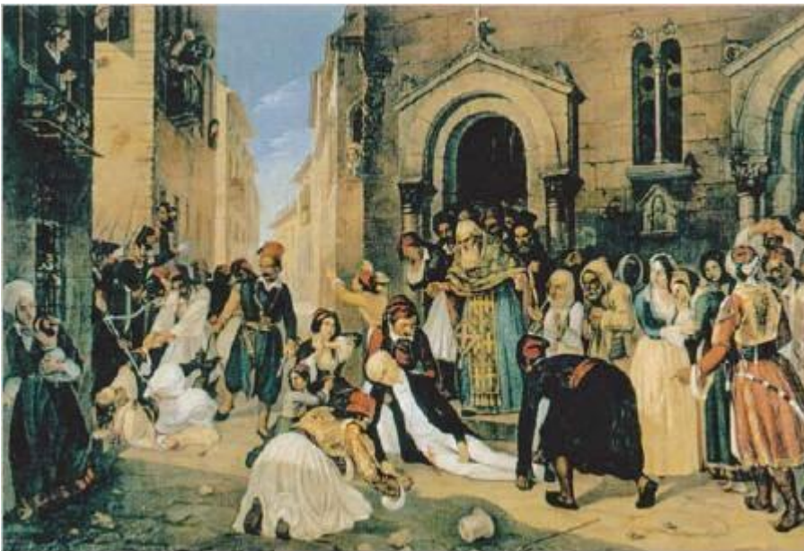
Η δολοφονία του Καποδίστρια