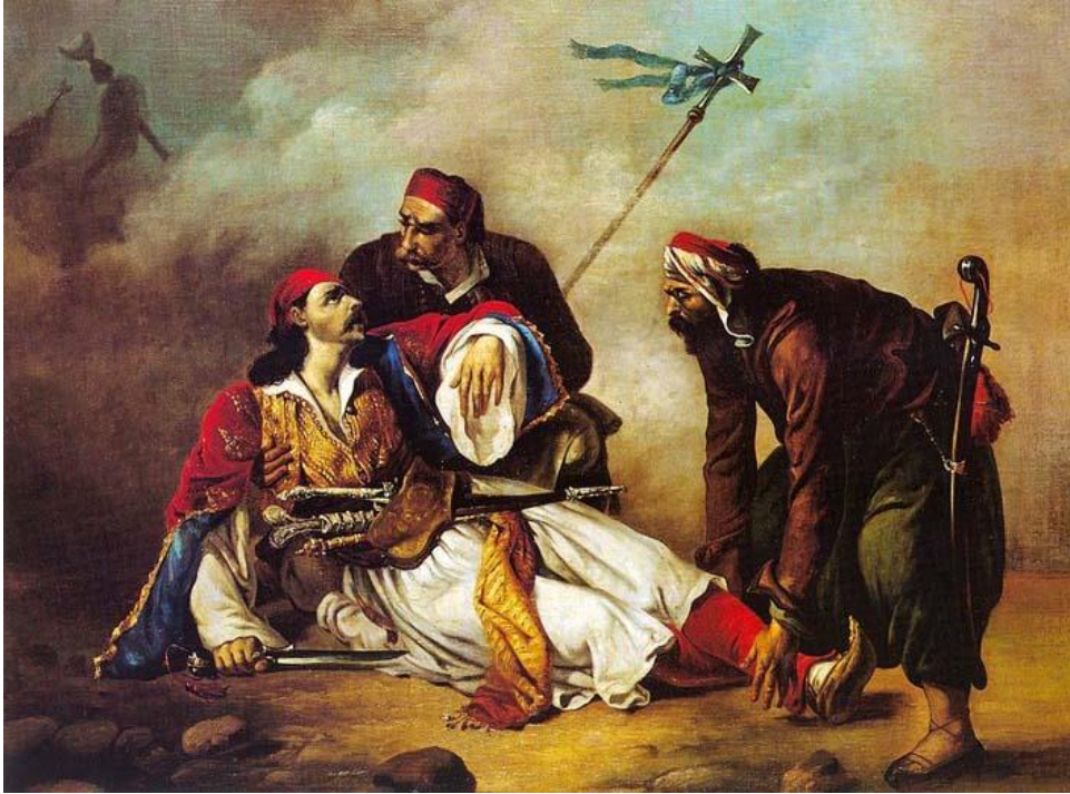
Ο Μάρκος Μπότσαρης αποχαιρετά την οικογένειά του

Ο Διογύσιος Τσόκος ήταν ένας από τους πρώτους εθνικούς ζωγράφους της μετα-οθωμανικής Ελλάδας. Έζησε από το 1800 έως 1862, ήταν επανήσιος και υπήρξε μαθητής του Λαπαρίνι, που τον γνώρισε το 1844, όταν πήγε να σπουδάσει στην Ακαδημία Τεχνών της Βενετίας. Το 1846 παίρνει μέρος σε μια έκθεση Ζωγραφικής στη Βενετία με θέμα του πίνακά του «Ο Μάρκος Μπότσαρης αποχαιρετά την οικογένειά του», θέμα που είχε επεξεργαστεί και παλιότερα ο δάσκαλός του, Λαπαρίνι. Με παραγγελία της ελληνικής Κυβέρνησης ζωγράφησε τα πορτρέτα των αγωνιστών της Επανάστασης του 1821.