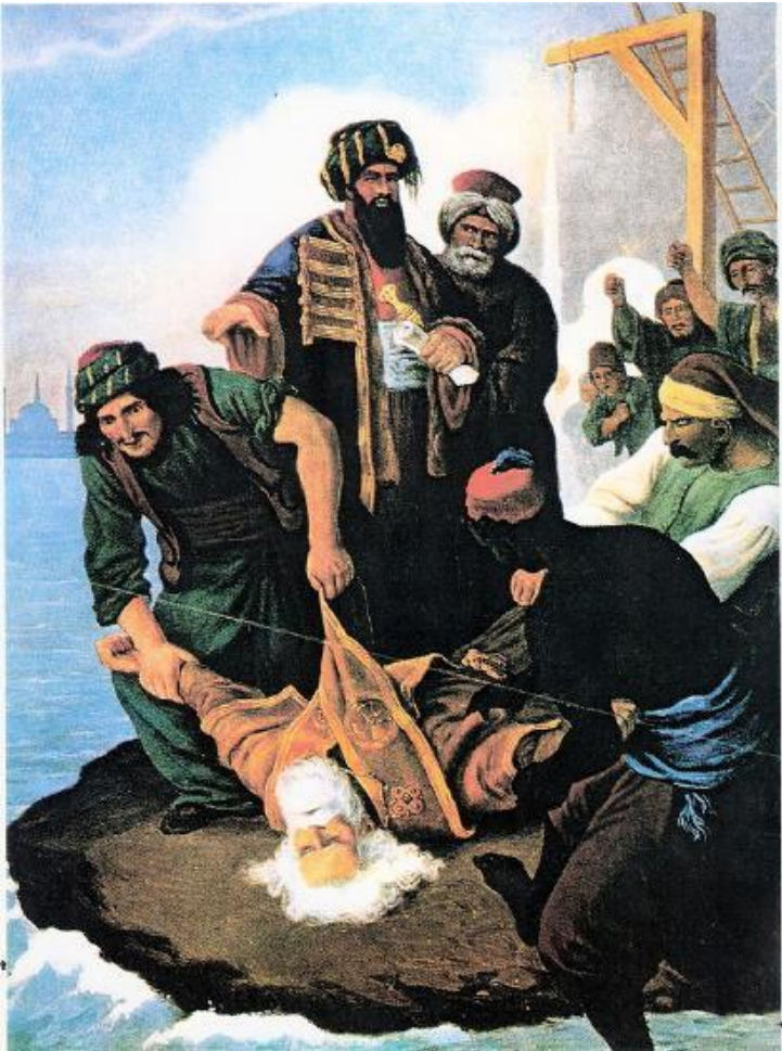
Ο απαγχονισμός του Πατριάρχη

Ο Γερμανός ζωγράφος Πέτερ φον Ες (Peter von Hess, 1792-1871) γοητεύτηκε από της ελληνική επανάσταση και μας άφησε μερικούς χαρακτηριστικούς πίνακες, όπως τον απαγχονισμό του Πατριάρχη Γρηγορίου το 1821 , την άφιξη του βασιλιά Όθωνα το 1834 του οποίου υπήρξε συνοδός κατά την έλευσή του καθώς και πίνακες του Ανδρέα Μιαούλη, της Μπουμπουλίνας και του Υδραίου πολεμιστή Αντώνη Οικονόμου.