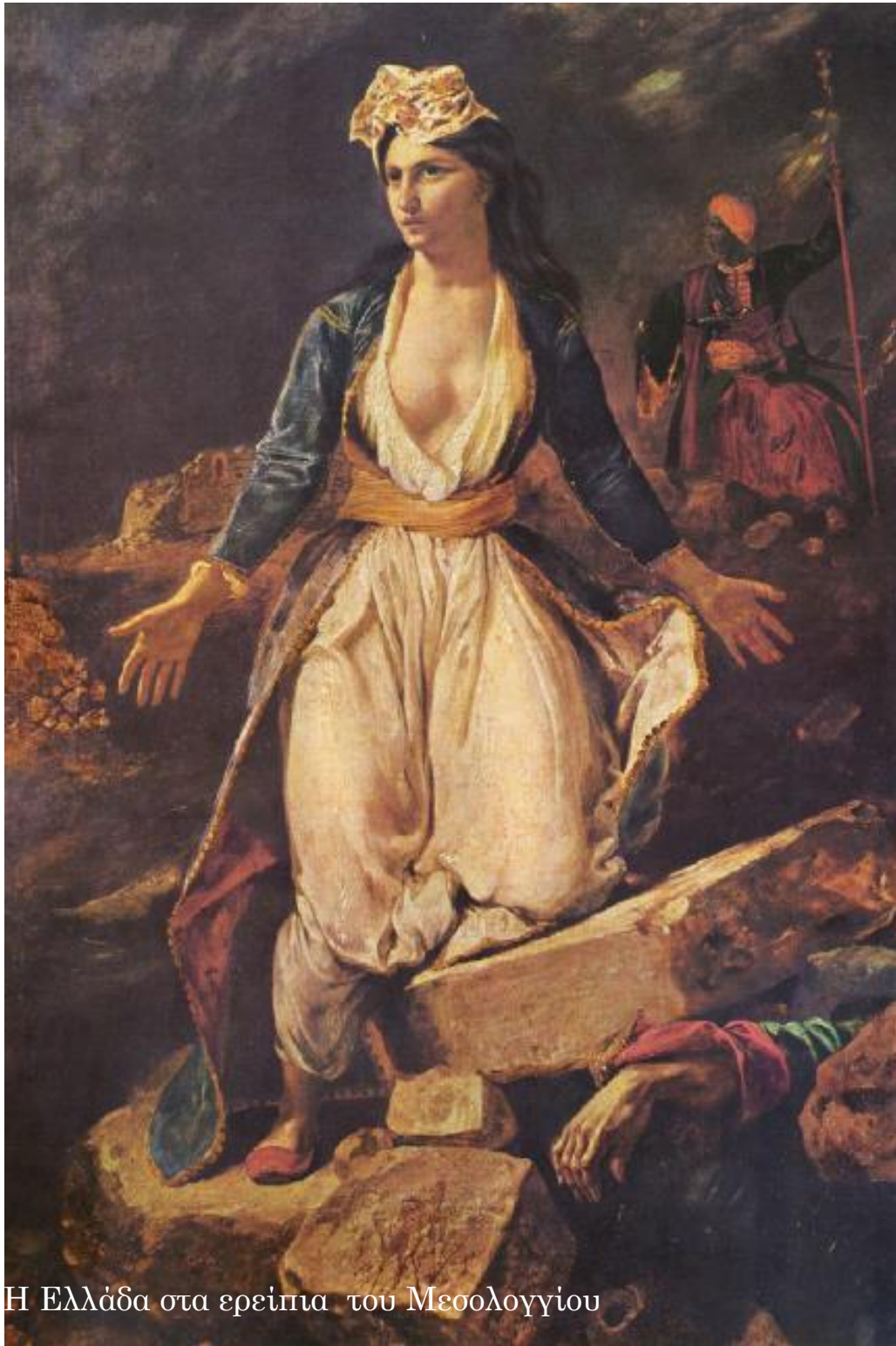
Η Ελλάδα στα ερείπια του Μεσολογγίου