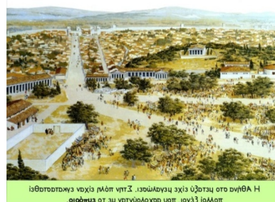
ισθμοπαγκας νοχίς μλόπ κητ Σ .ισούλωνεμ εχίε υζατεμ στο ανηθα Η .οιόπμσι στ εχ κτηνύλοσο υποπ .ιανζξ ιολλοισ