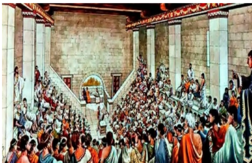
Κάθε φυλή εξέλεγε έναν στρατηγό και πενήντα βουλευτές.