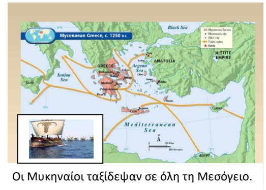
Οι Μυκηναίοι ταξίδευαν σε όλη τη Μεσόγειο.