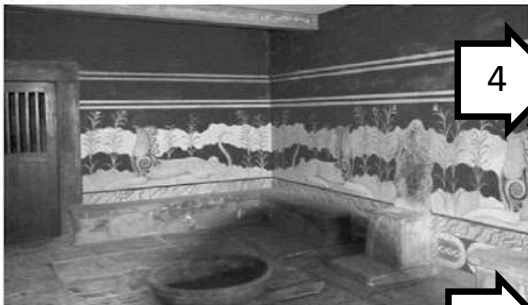
Η αίθουσα του θρόνου