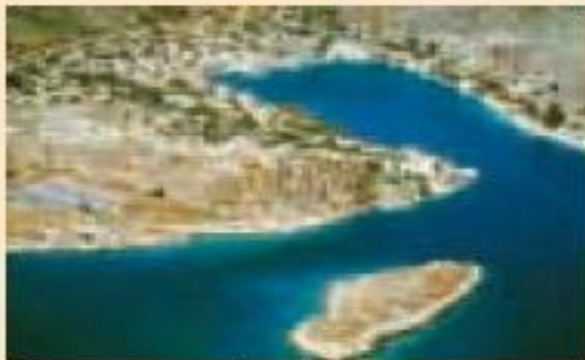
Νησί και κόλπος