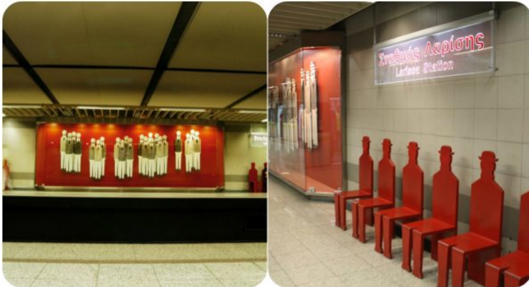
Τα ανθρωπάκια του Γιάννη Γαϊτή στον σταθμό Λαρίσης