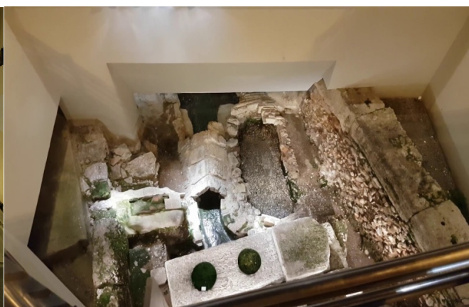
Κομμάτι της αρχαίας Αθήνας & ο Ηριδανός ποταμός στο Μοναστηράκι