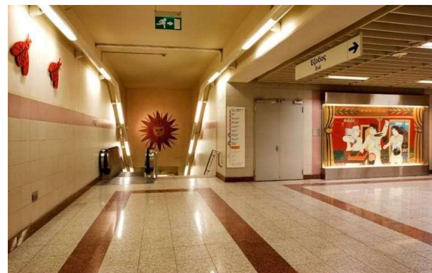
Έργα του Αλέκου Φασιανού στο Μεταξουργείο