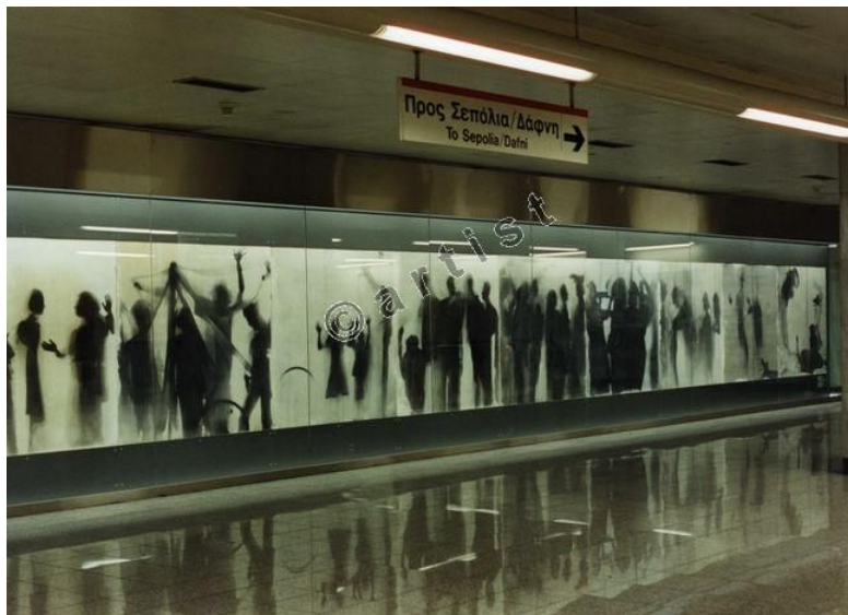
«Η ουρά»- έργο του Νίκου Κεσσαυλή στην Ομόνοια