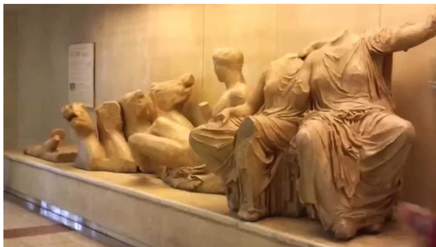
Αρχαία εκθέματα στον σταθμό της Ακρόπολης