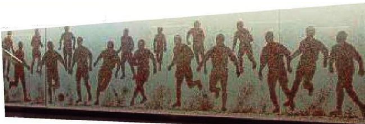
Έργο του Παύλου στην Ομόνοια