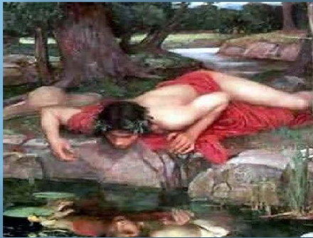
Ο Νάρκισσος καθρεφτίζεται στα νερά του ποταμού.

Σύμφωνα με μία από αυτές, ο νέος ήταν τόσο όμορφος που τον είχαν ερωτευτεί όλες οι νύμφες του δάσους. Εκείνος όμως τις αγνοούσε και αυτοθαύμαζε το καθρέφτισμά του στο νερό. Οι θεοί αποφάσισαν να τον τιμωρήσουν και κάποια μέρα έπεσε στο νερό και πνίγηκε. Απόμεινε όμως ένα λευκό λουλούδι με χρυσό στεφάνι στο κέντρο να τον θυμίζει.