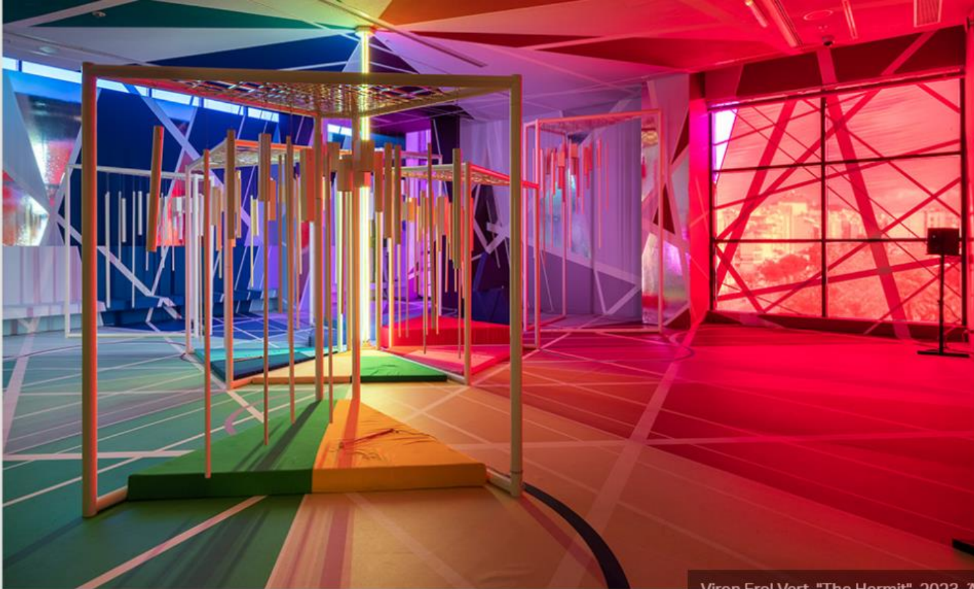
Viron Erol Vert, "The Hermit", 2023. Άποψη εγκατάστασης στο ΕΜΣΤ. Φωτογραφία