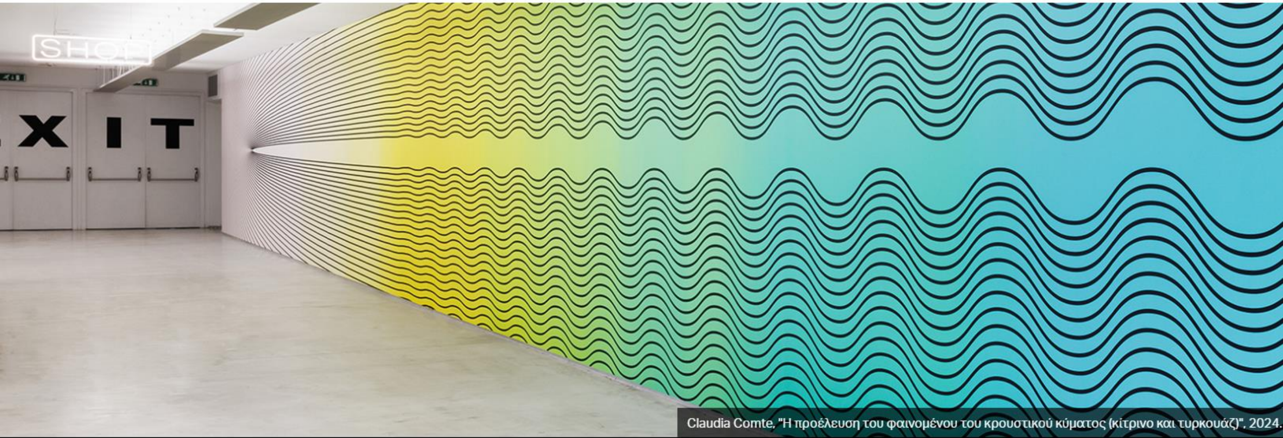
Claudia Comte, "Η προέλευση του φαινομένου του κρουστικού κύματος (κίτρινο και τυρκουάζ)", 2024.