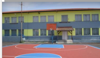
8 ο Νηπιαγωγείο Βέροιας