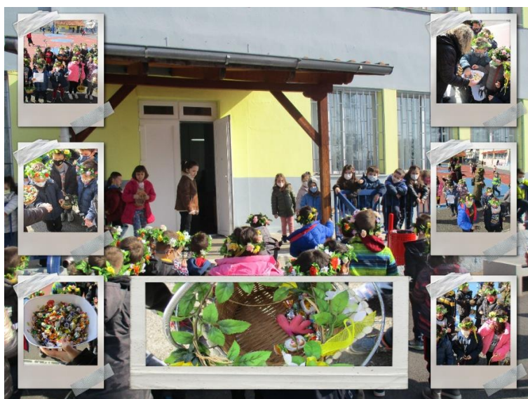
Χελιδονίσματα από τους μαθητές και μαθήτριες της Α΄ Δημοτικού.