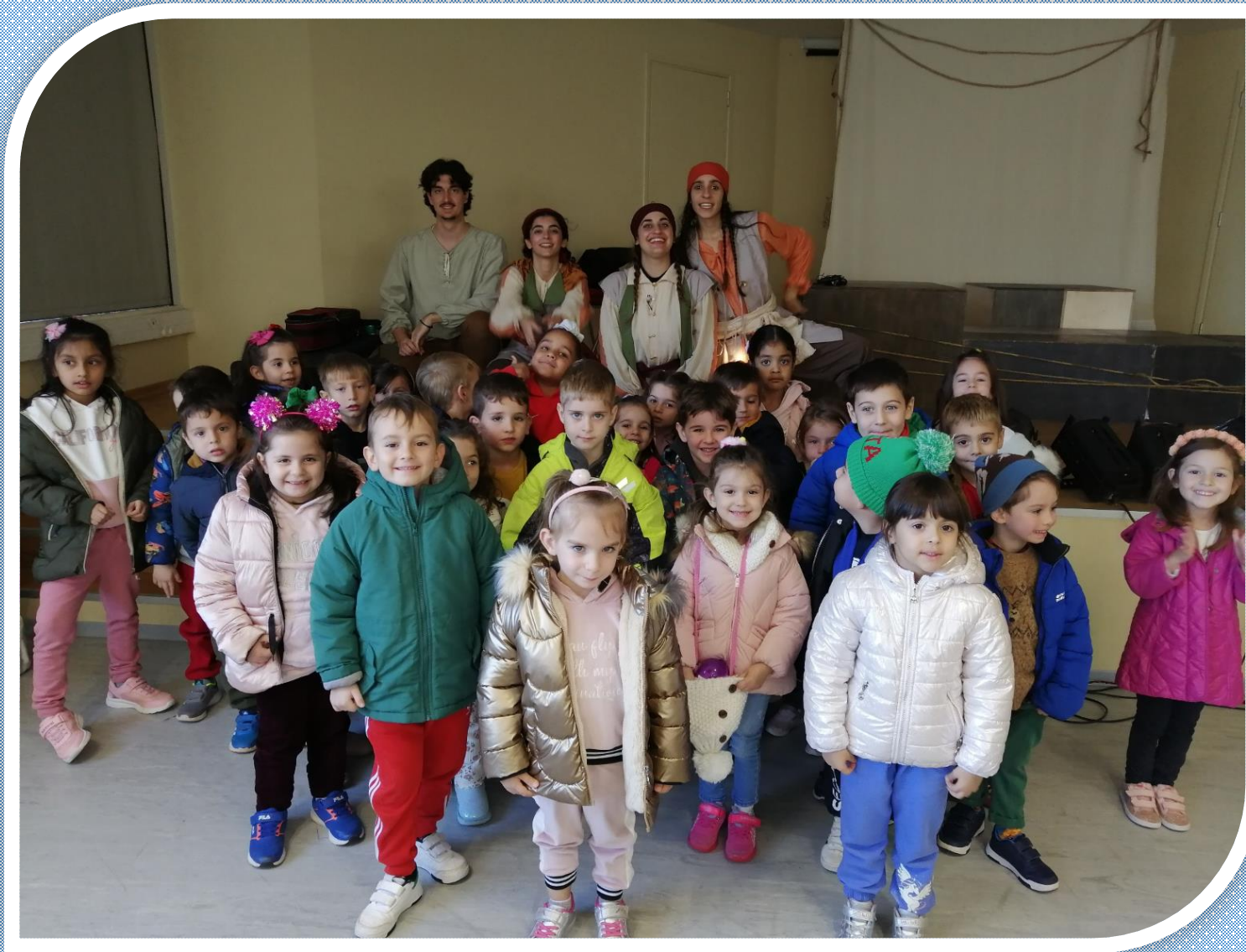
Πρωτότυπο κείμενο: Γεώργιος Βιζηηνός Διασκευή-Σκηνοθεσία-Σκηνογραφία: Άννα Παπαμάρκου Θεατρική Ομάδα: Λώτινος Ήλιος