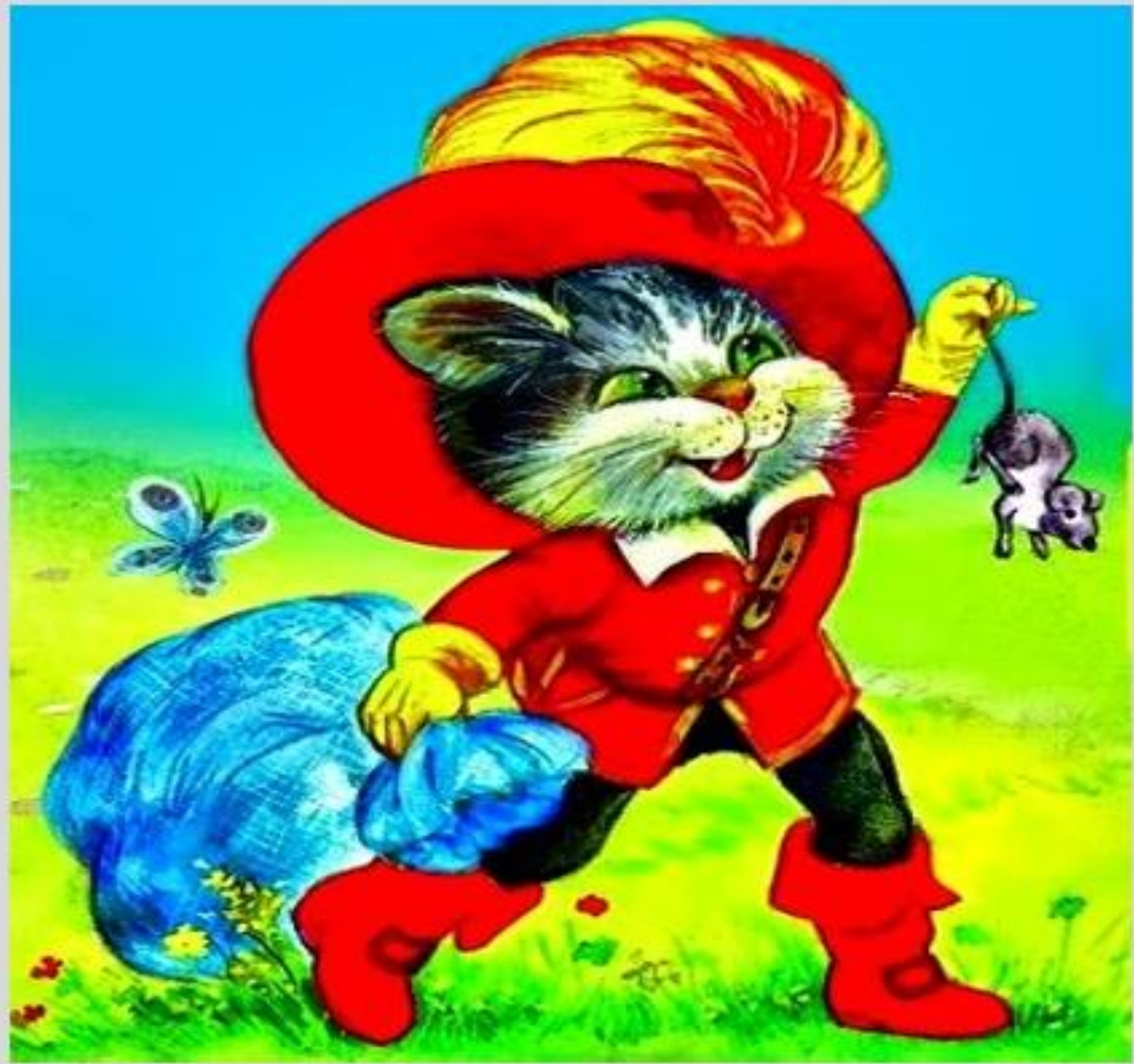
Ο αδέσποτος γάτος