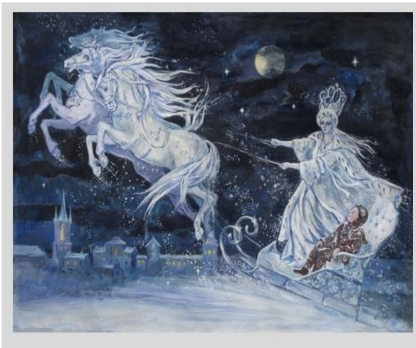
Η βασίλισσα των πάγων