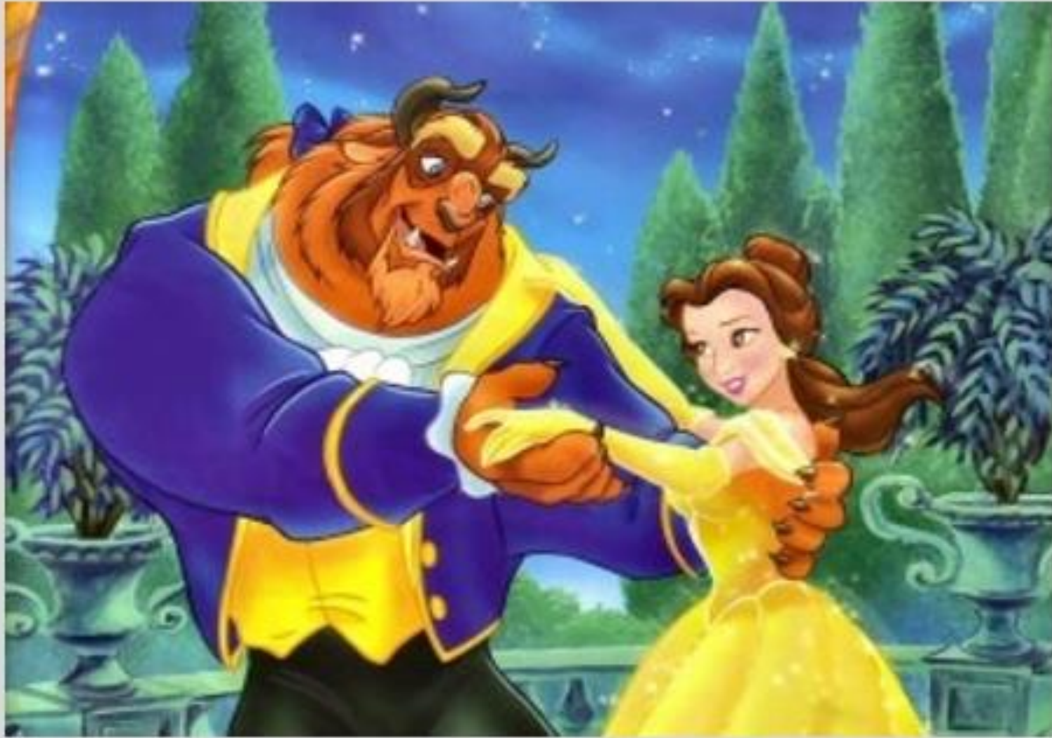
Η όμορφη και ο γίγαντας