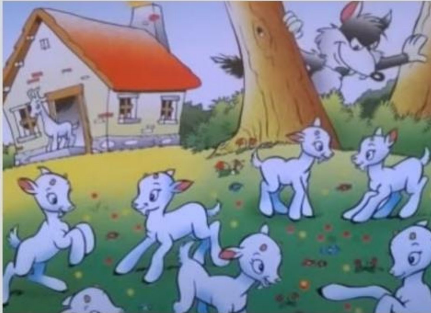
Ο λύκος και τα οκτώ κατσικάκια