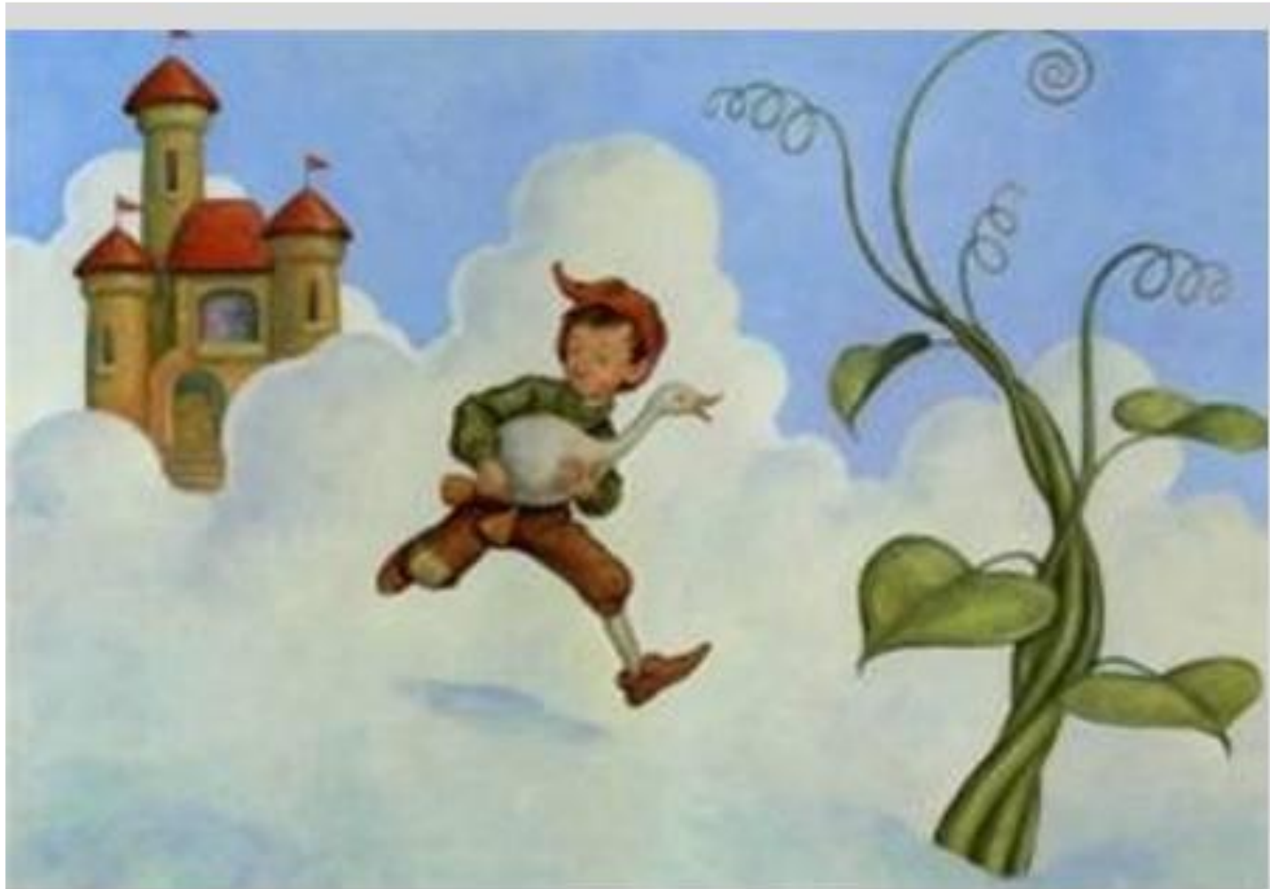
Ο Μιχάλης και η ντοματιά