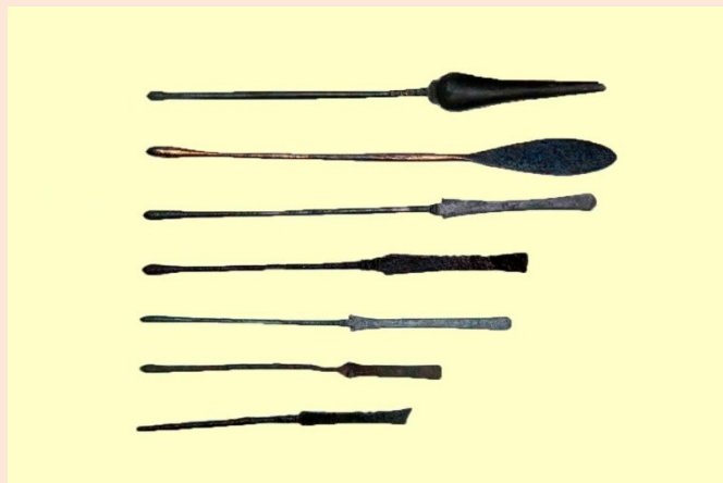
Μεταλλικές σπάτουλες Ρωμαϊκή Περίοδος

Στη λειτουργία οργανωμένων ιατρείων στην Πάτρα συνηγορούν οι γραπτές πηγές, αλλά και τα αρχαιολογικά τεκμήρια.