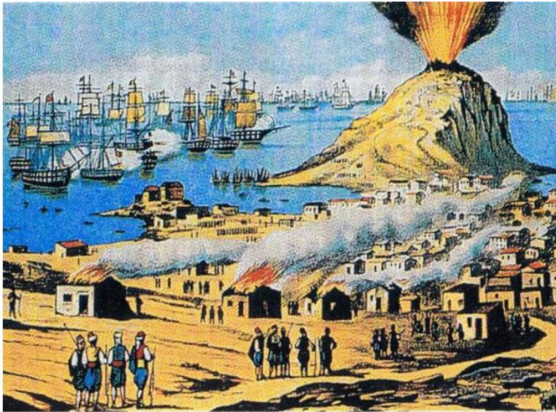
Πίνακας λαϊκού ζωγράφου