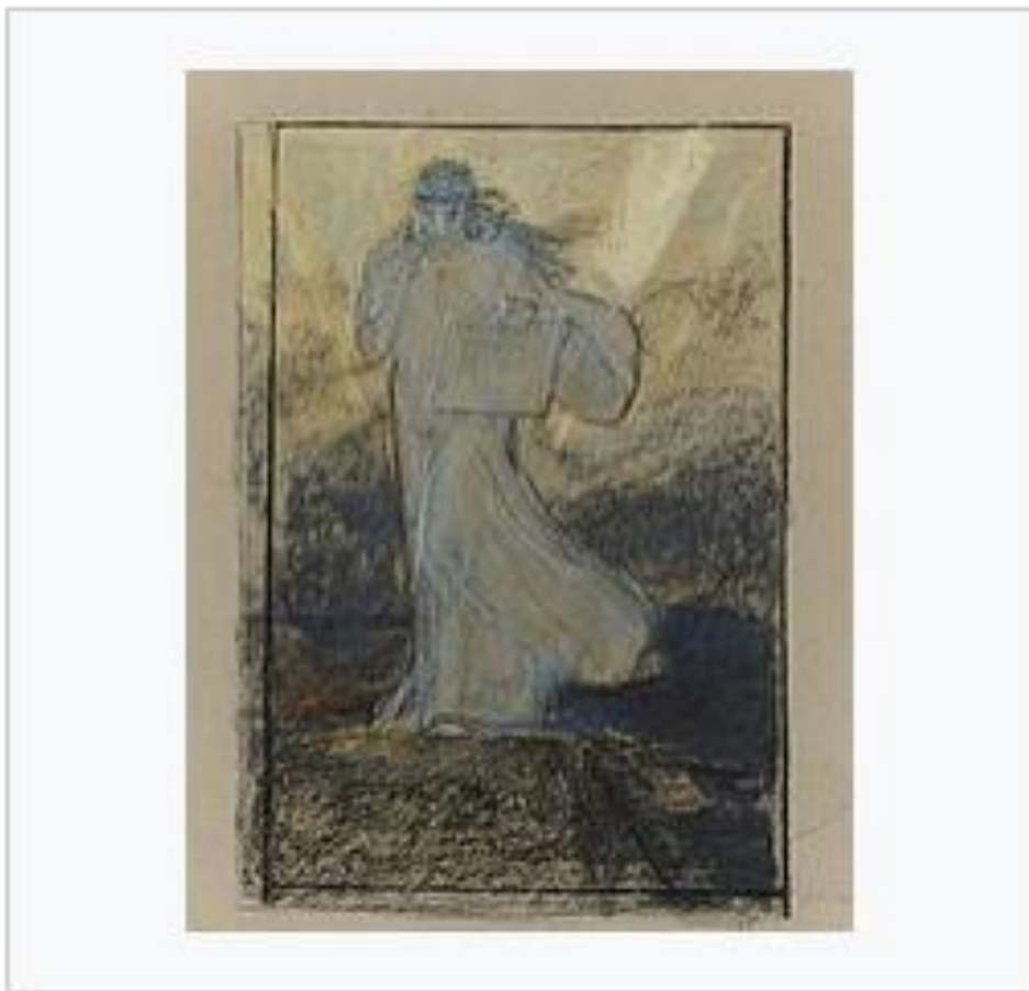
Δόξα των Ψαρώ, παστέλ σε χαρτί, 1896