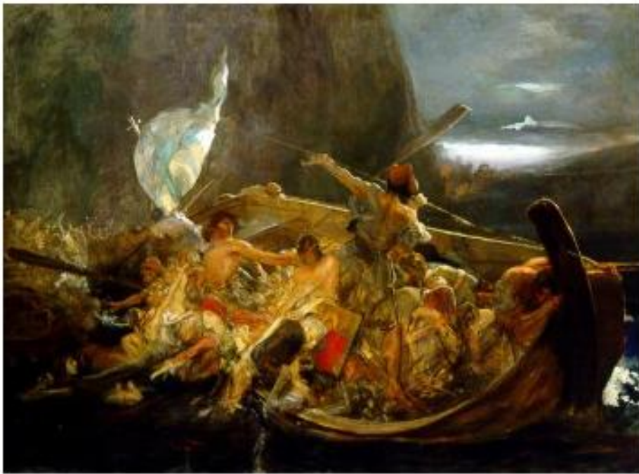
Μετά την καταστροφή των Φαρών, Νικόλαος Γύζης