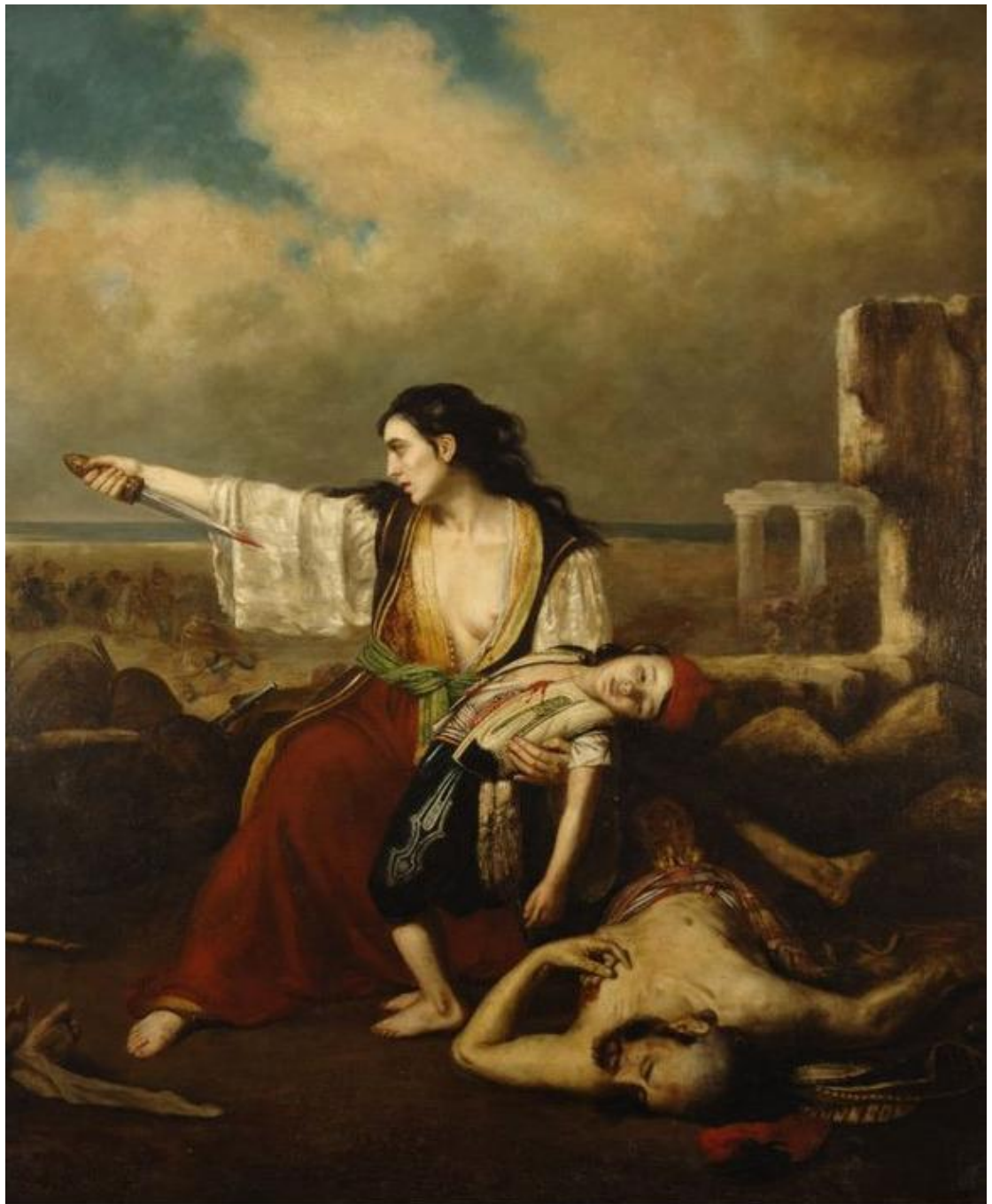
«Η αυτοθυσία της μάνας», Εμίλ ντε Λανσάκ, 1827