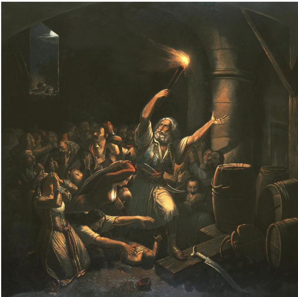
«Η θυσία του Καψάλη», Θεόδωρος Βρυζάκης