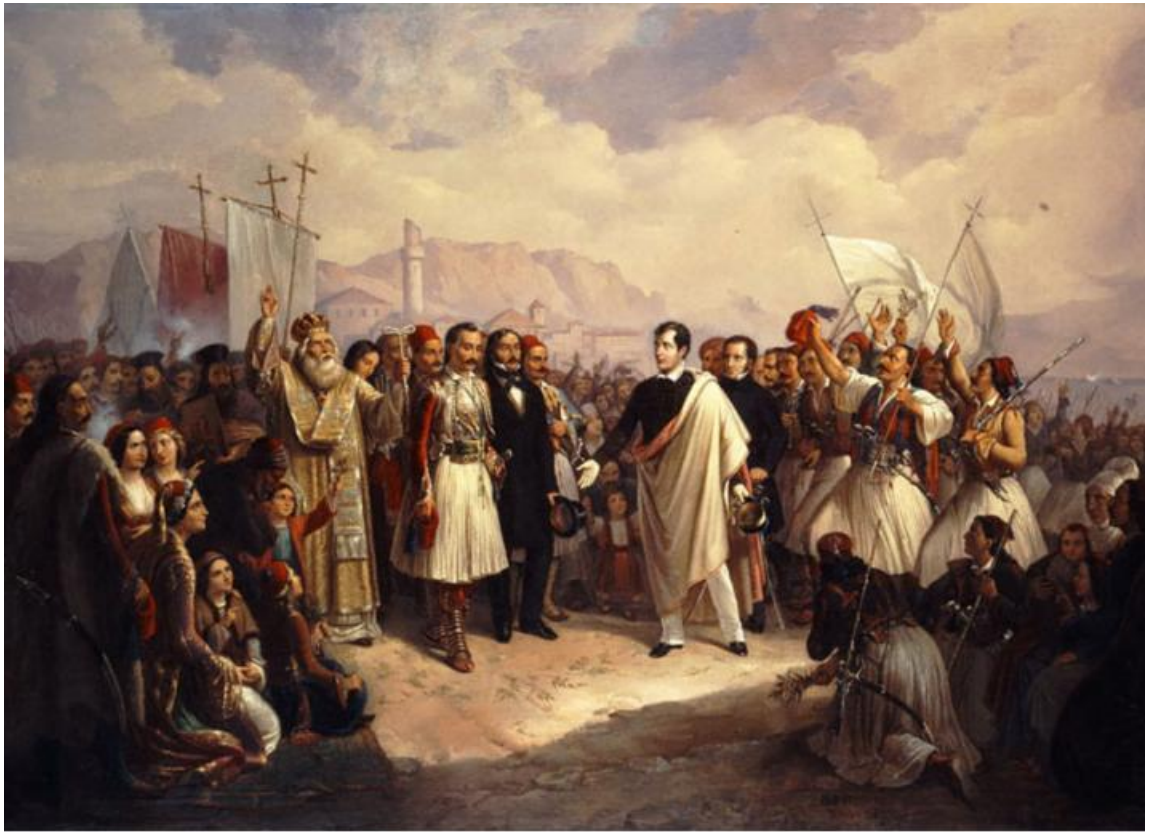
«Η υποδοχή του Λόρδου Βύρωνα στο Μεσολόγγι», Θεόδωρος Βρυζάκης, 1861