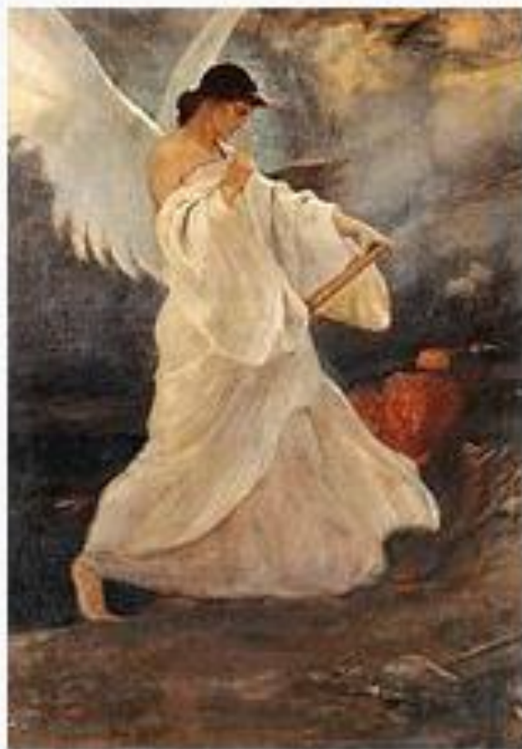
Δόξα των Φαρώ, λάδι σε καμβά, 1898