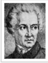
Διονύσιος Σολωμός (1798-1857)