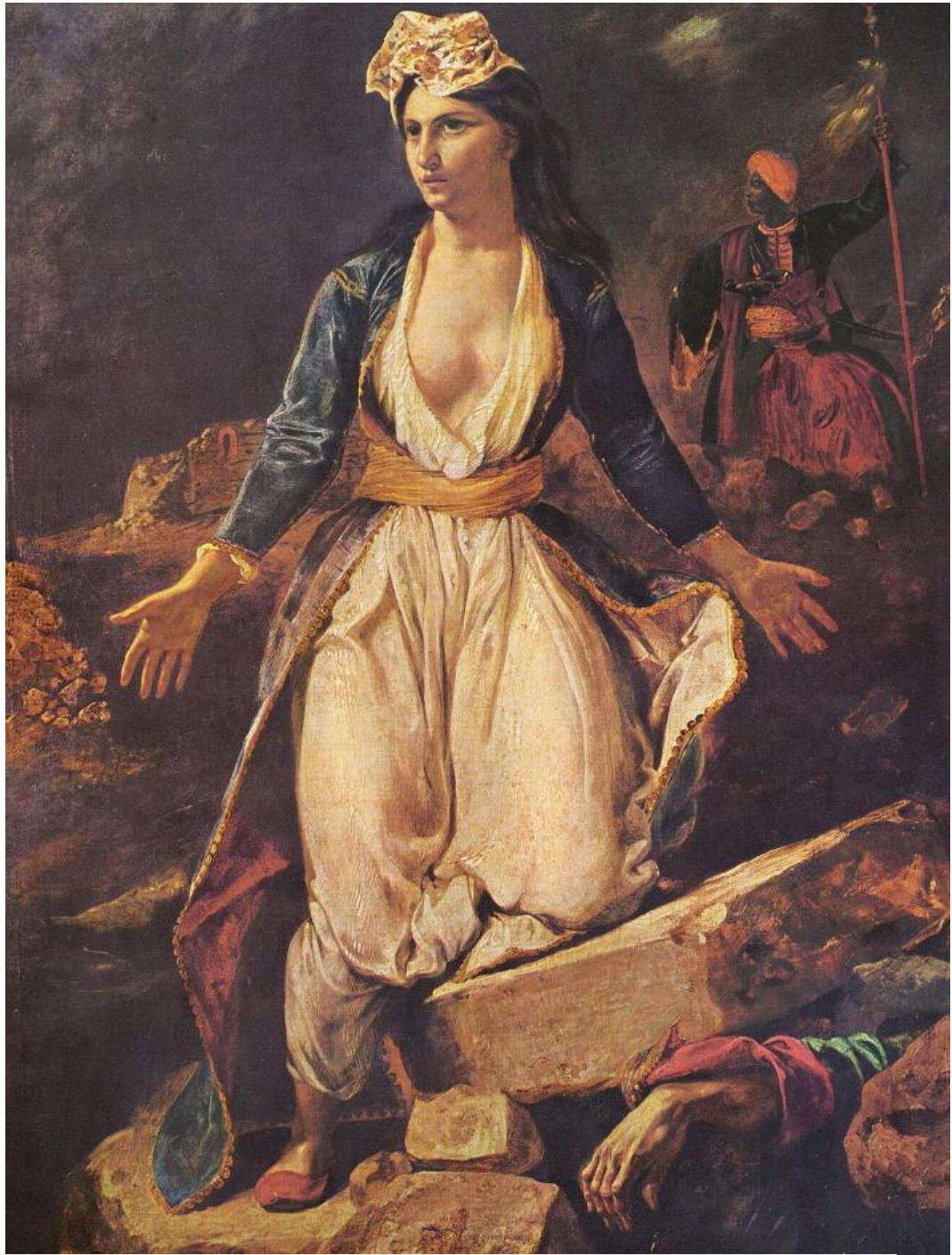
«Η Ελλάδα πάνω στα ερείπια του Μεσολογγίου», Ευγένιος Ντελακρουά, 1826