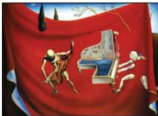
Σαλβαντόρ Νταλί: «Η κόκκινη Ορχήστρα-Οι επτά τέχνες»

Η μουσική αποτελεί αρχικά έκφραση συναισθημάτων και ιδεών, όμως μελετώντας τη μουσική δημιουργία στα βάθη των αιώνων θα παρατηρούσε κανείς ότι πάντα υπάρχει στους συνθέτες έντονη η επιθυμία να «αναπαραστήσουν» εικόνες μέσω της μουσικής, πράγμα που αποτελεί παραδοσιακά πεδίο των εικαστικών τεχνών.