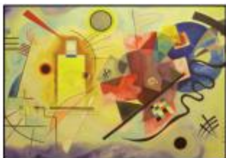
Καντίνσκι: «Κίτρινο, Κόκκινο και Μπλε»

«Το ανοικτό μπλε, μουσικά αναπαριστάμενο, είναι όμοιο με έναν αυλό, το σκούρο με ένα τσέλο... το γκρίζο στερείται ήχου και κίνησης... ενώ το βιολετί είναι στον ήχο παρόμοιο με το αγγλικό κόρνο και τη φλογέρα».