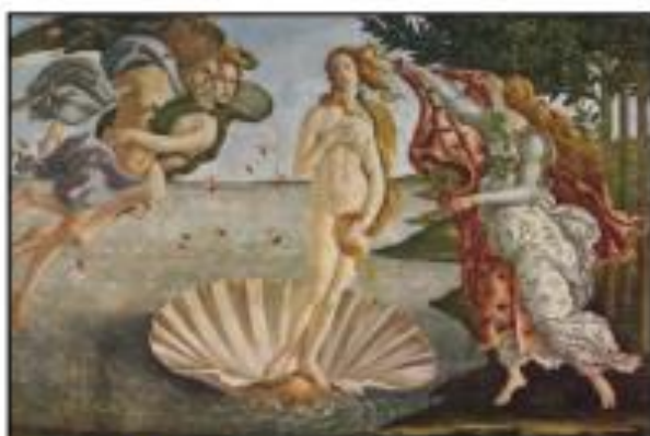
Μποττιτσέλλι: «Η Άνοιξη»