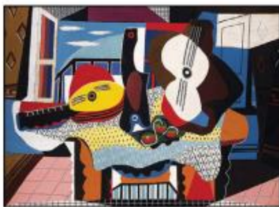
Πάμπλο Πικάσο: «Μαντολίνο και κιθάρα»