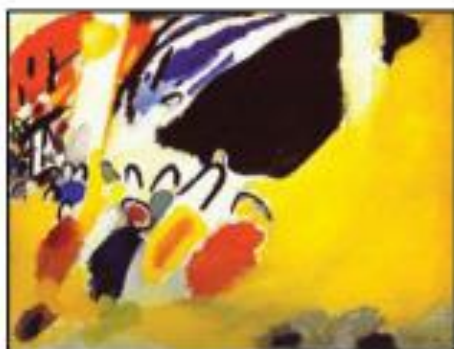
Καντίνσκι: «Εντύπωση III» (κονσέρτο)

Ο συνθέτης Κλ. Ντεμπισύ εμπνεύστηκε από τους πίνακες του Μποτισσέλλι («Άνοιξη») και ο Ζωρζ Μπρακ από τα έργα του Ντεμπισύ. Ο συνθέτης Α. Σαίνμπεργκ ανταλλάσσει ιδέες με το Β. Καντίνσκι, ο συνθέτης Τζ. Κέπτζ συνδέεται με στενή φιλία με τον Μαρσέλ Ντυσάν και ούτω καθ' εξής.