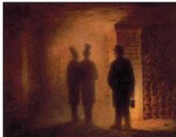
Β. Α. Χάρτμαν: «Κατακόμβες του Παρισιού», ένας από τους πίνακες που ενέπνευσε τον συνθέτη Μ. Μουσόργκι για τη σύνθεσή του «Εικόνες από μια Έκθεση»

Τον 20ό αι. οι ανταλλαγές μεταξύ των συνθετών και των εικαστικών καλλιτεχνών γίνονται πιο συχνές, συνενώνοντας με αυτό τον τρόπο τις δύο τέχνες.