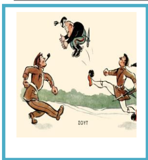
ΤΟ ΕΠΟΣ ΤΟΥ 40