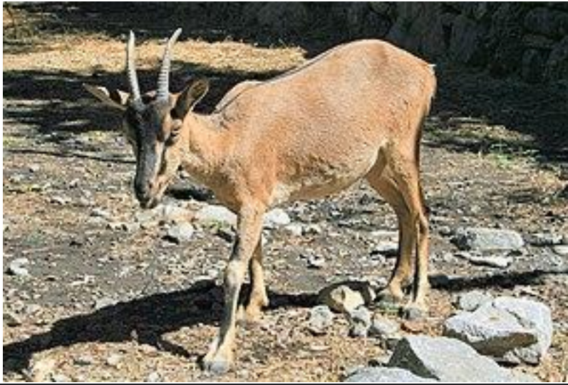
Το Κρι-κρι (το κρητικό αγριοκάτσικο) ζει σε προστατευμένα φυσικά πάρκα στο φαράγγι της Σαμαριάς και στο νησί των Αγίων Θεοδώρων