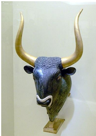
Μινωικό ρυτό σε μορφή ταύρου

Τα παλαιότερα ίχνη κατοίκησης στο χώρο του ανακτόρου ανάγονται στη νεολιθική εποχή (7000-3000 π.Χ.). Η κατοίκηση συνεχίζεται στην προανακτορική περίοδο (3000-1900 π.Χ.), στο τέλος της οποίας ο χώρος ισοπεδώνεται για την ανέγερση ενός μεγάλου ανακτόρου. Το πρώτο αυτό ανάκτορο καταστρέφεται, πιθανότατα από σεισμό, το 1700 π.Χ. περίπου.