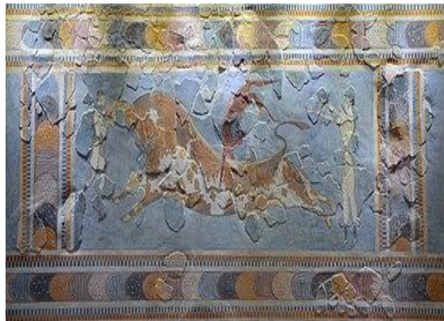
Μινωική τοιχογραφία από την Κνωσό