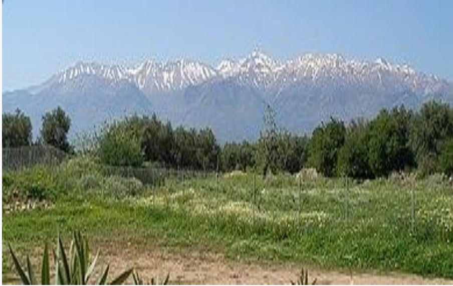
Τα Λευκά Όρη