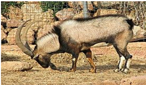
Αρσενικό κρητικό αγριοκάτσικο