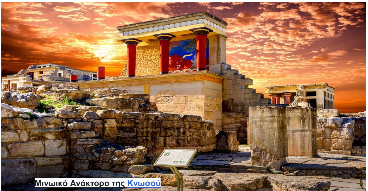
Μινωικό Ανάκτορο της Κνωσού

Η Κνωσός είναι ο μεγαλύτερος αρχαιολογικός χώρος της εποχής του Χαλκού στην Κρήτη και έχει ονομαστεί η αρχαιότερη πόλη της Ευρώπης.