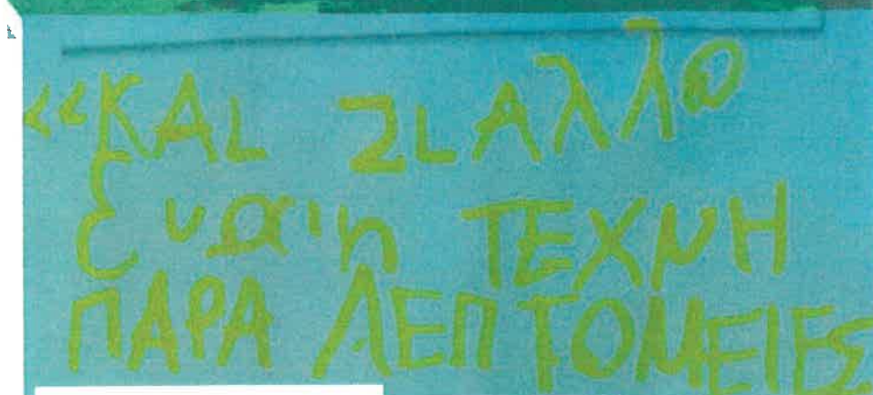
Κ. Π. Καβάφης