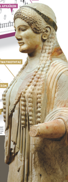
Επιτύμβια κλαύση από τον 5ο αιώνα π.Χ.