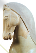
Ένα από τα τέσσερα άλογα τριήμερο από τον 5ο αιώνα π.Χ. (Παρθενώνας).