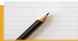
μολύβι και χαρτί