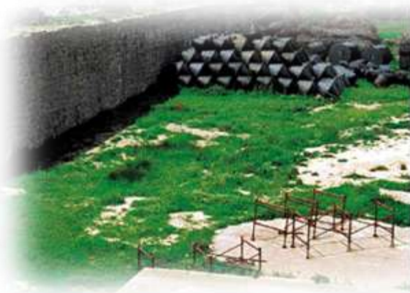
κάστρο του Ρίο

ευρώ για το κάστρο του Ρίου και 5 εκατ. ευρώ για το πολύ μικρότερο κάστρο του Αντιρρίου. Όλα αυτά όμως βρίσκονται στα... χαρτιά!