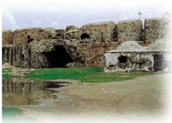
κάστρο του Αντιρρίου

Στο κάστρο του Ρίου σήμερα η εικόνα που αντικρίζει κανείς είναι θλιβερή. Τα κτίσματα στο εσωτερικό του κάστρου είναι μισογκρεμισμένα, με εμφανή τα πλήγματα του χρόνου αλλά και της σημερινής αδιαφορίας. Δεν υπάρχει κανένα σημάδι περιποίησης, ανάπλασης ή επισκευής στον χώρο αυτόν. Το καλοκαίρι βεβαίως γίνονται με πρωτοβουλία του δήμου διάφορες εκδηλώσεις μέσα στο κάστρο. Η αίτηση όμως προς την Αρχαιολογική Υπηρεσία για την αναστήλωσή του έμεινε αναπάντητη.