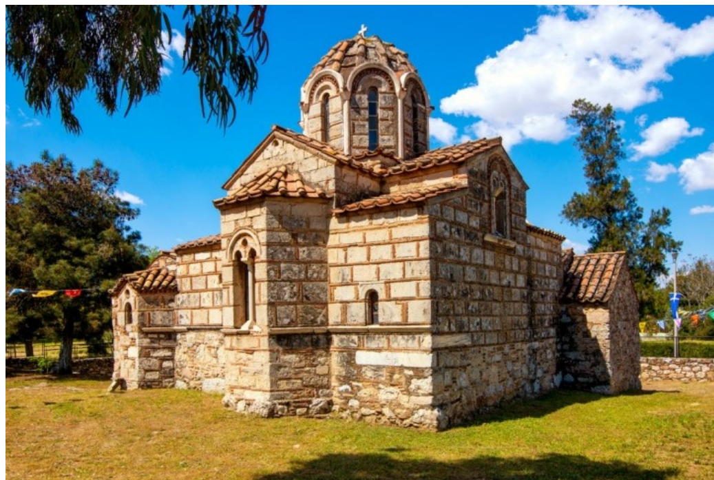
Ηρακλής, Χριστίνα και Χρήστος