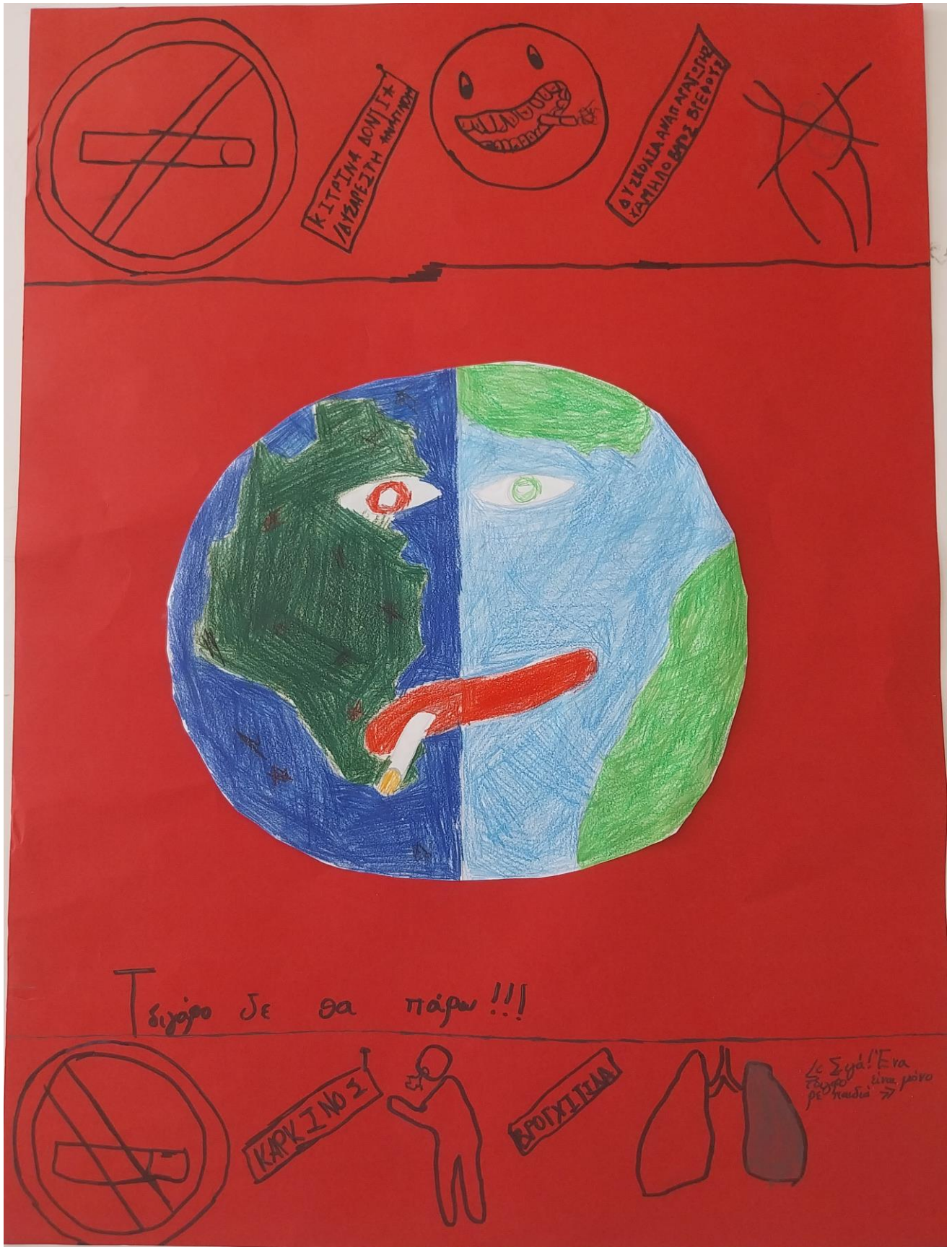
ΑΦΙΣΑ ΤΗΣ ΟΜΑΔΑΣ ΕΝΤΥΠΗΣ ΔΗΜΙΟΥΡΓΙΑΣ