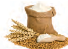
δημητριακά ρύζι αλεύρι