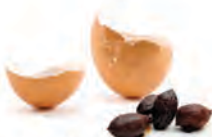
τσόφλι αυγού κουκούτσι ελιάς