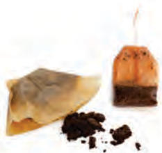
υπολείμματα & φίλτρα καφέ φακελάκι τσάι