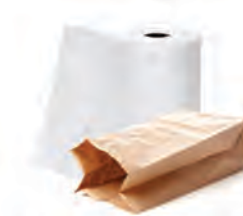
χαρτί κουζίνας χαρτοσακούλες