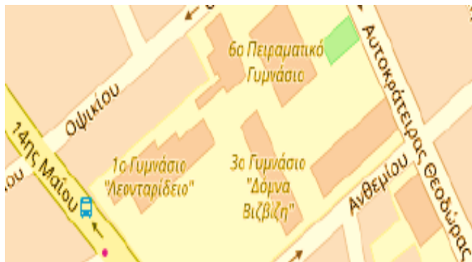
Κάτοψη 2 ου Χώρου Καταφυγής

II. Χώρος συγκέντρωσης σε περίπτωση ανάγκης. Ενδεικτικό σχέδιο: