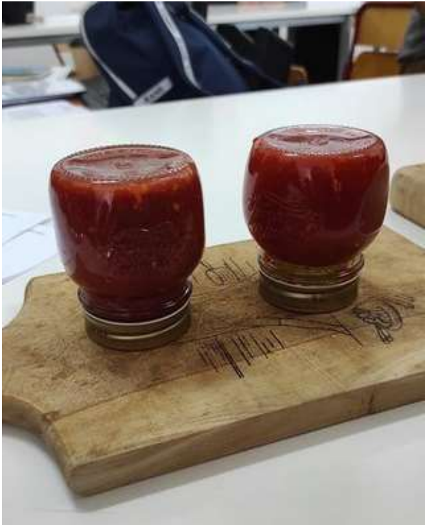
Σάλτσα τομάτας με ρίγανη και θυμάρι