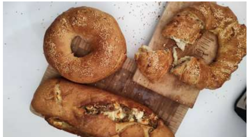
Ελιόψωμο & τυρόψωμο με ρίγανη, θυμάρι και θρούμπη