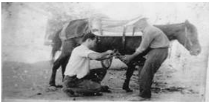
Ο αλμπάντης (πεταλωτής)