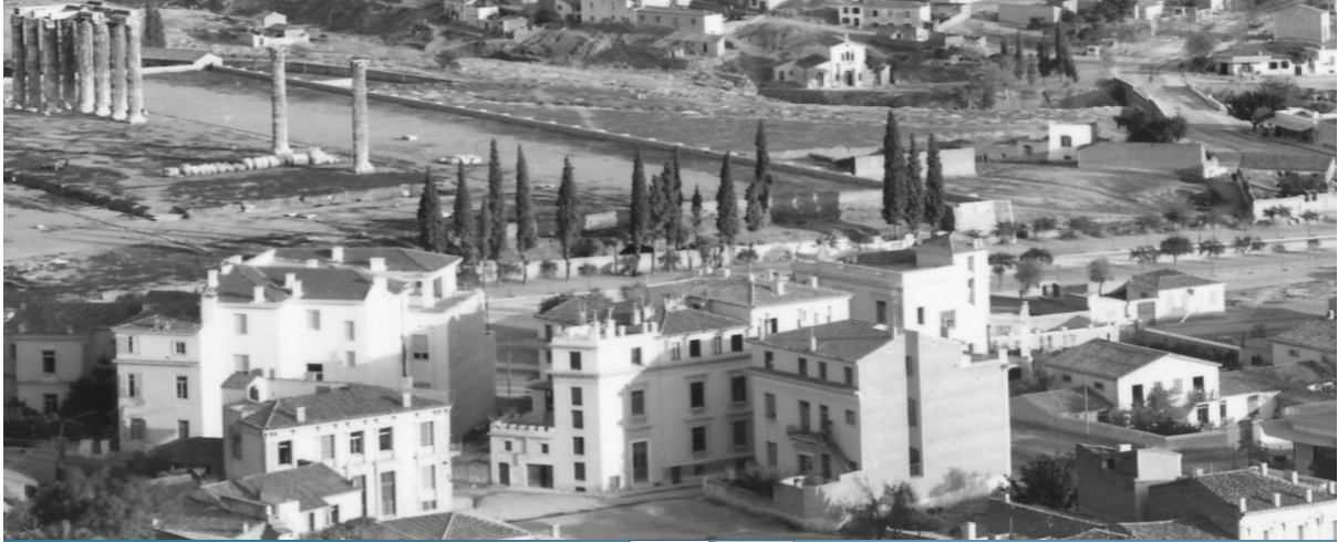
Εικόνα 5: Οι σπηλιές διακρίνονται πίσω από το τοίχιο που ανήγειρε η αρχαιολογική υπηρεσία. (Woodhouse,1910)

τῶν Ἀθηνῶν. Μάταιος κόπος! Ἡ πρόοδος καί ὁ πολιτισμός δέν μπορούσαν ν' ἀνεχθοῦν τήν ὑπαρξή μιᾶς σπηλιάς πού ἴσως νά μὴν εἶχε καμμιά γραφικότητα, θά γεννοῦσε ὁμως τόση περιέργεια, ὥστε καί τούς ἀνίδεους ἀκόμη θά τούς ἔκανε νά μάθουν μιά σελίδα τῆς ἱστορίας τοῦ τόπου πού δέν πρέπει ν' ἀγνοοῦν. Πάει λοιπόν καί ἡ σπηλιά... (Αγγελομάτης, 1937: 276-278)