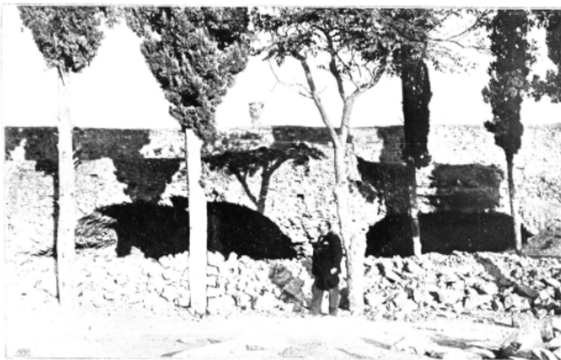
Η "ΣΠΗΛΙΑ.. ΤΟΥ ΜΑΚΡΥΓΙΑΝΝΗ (ἀριστοτέρ τῶ Θεωμένου).

[...] ή αρχαιολογική ύπηρεσία έχτισε κι αυτή τήν πλευρά τοῦ περιβόλου, αλλά καί πάλι—ίσως γιατί θέλησε νά προορίση τό ναό γιά καθαρά χῶρο ἀρχαιολογικό— δέν ἄφησε πιά νά γίνει ἐκεῖ κανένα κέντρο κοινωνικό, οὔτε καί σχολικές ἀσκήσεις. Τέτοιο πνεῦμα φανατισμοῦ δασκάλικου βασίλευε [...]. Για τόν Ἕλληνα ἀρχαιολόγο δέν ὑπάρχει παρά ἀρχαιολογία καί τίποτε ἄλλο. (Βλαχογιάννης, 1950: 636)