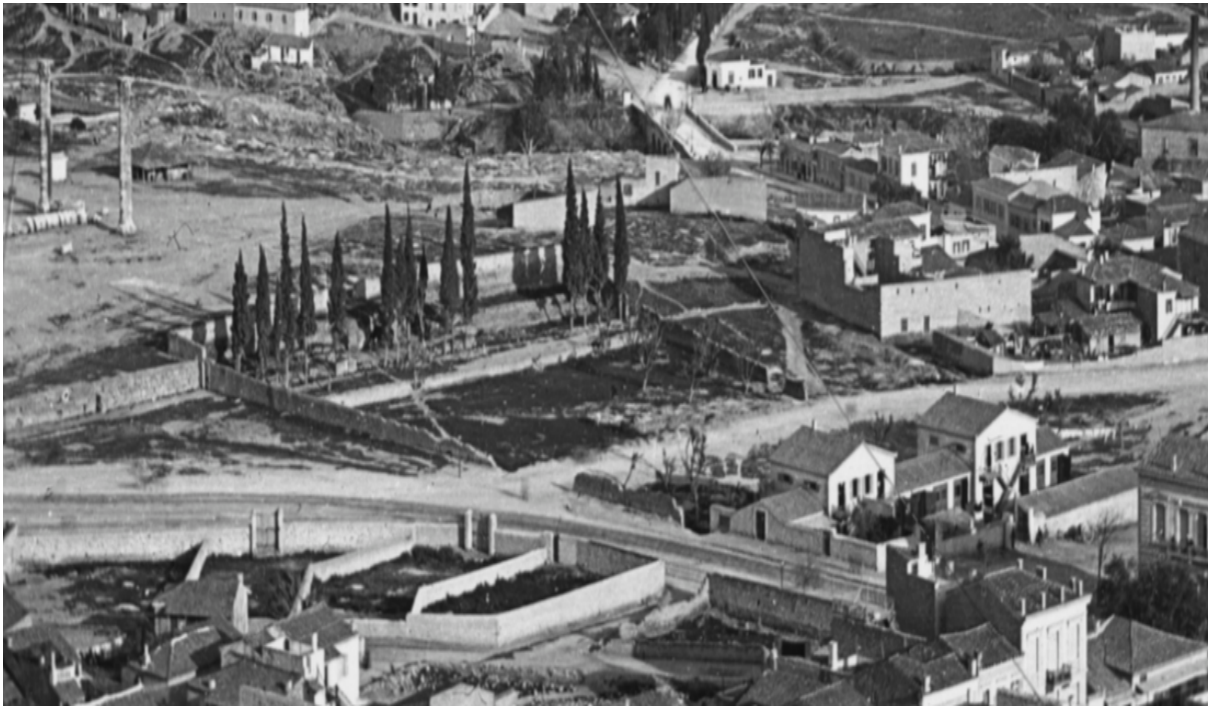
Εικόνα 7: Οι σπηλιές του Μακρυγιάννη και ο κατεστραμμένος κήπος του πριν ανοίξει η λεωφόρος Συγγρού.

Οι πολυετείς αγώνες του Μακρυγιάννη δικαιώνονται, όταν, όπως σημειώνει ο Ι. Βλαχογιάννης (1907: Α', πζ'): «Κατά τήν ἐπανάστασιν τῆς 10 Ὀκτωβρίου 8 ἔνθους ὁ ἐπαναστάτης λαός, ἐνεθυμήθη ἐν τῇ μέθῃ τῆς νίκης αὐτοῦ τόν παλαιόν αὐτοῦ ἀρχηγόν Μακρυγιάννην, μεταβάς δέ εἰς τόν οἶκον αὐτοῦ παρέλαβε καί περιῆγαγεν αὐτόν θριαμβευτικῶς ἀνά τήν πόλιν».