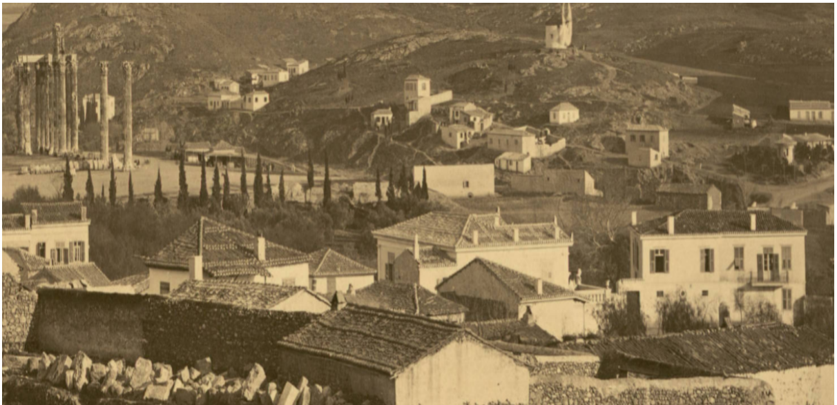
Εικόνα 2: Ο κήπος του Μακρυγιάννη διακρίνεται στο αριστερό μέρος της φωτογραφίας. (Granges, 1869)

Οι λεπτομέρειες της αφήγησης και της περιγραφῆς, ιδιαίτερα της σπηλιάς, η οποία προορίζεται για εκκλησιάκι, υποδεικνύουν προφορικές πιθανόν παραδόσεις σε αυτόν, κυρίως