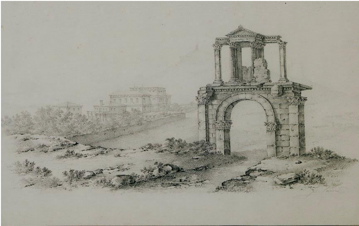
Εικόνα 3: Το σπίτι και ο κήπος του Μακρυγιάννη αριστερά της Πύλης του Αδριανού. Πίσω τους διακρίνεται το στρατιωτικό νοσοκομείο (Κτίριο Weiler). Σχέδιο με μολύβι. (Tarone, 1836-1840)

Ο Μακρυγιάννης, σε δύσκολες ιστορικά συνθήκες, συνδυάζει την οικογενειακή και καλλιτεχνική ευαισθησία, με την ακατάβλητη μαχητικότητα για την υπεράσπιση της πατρίδας και της θρησκείας του. Η δύναμη της πολύπλευρης προσωπικότητάς του εκφράζεται με ιδιαίτερο τρόπο στον ευρύτερο χώρο του κήπου του: