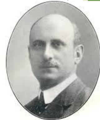
Cav. Prof. Rag. FILIPPO RAVIZZA Propaganda Adviser to the Savings Bank of the Provinces of Lombardy. Organizing Secretary.

Η Παγκόσμια Ημέρα Αποταμίευσης θεσπίστηκε στις 31 Οκτωβρίου 1924, κατά τη διάρκεια του 1ου Διεθνούς Συνεδρίου Ταμιευτηρίων στο Μιλάνο της Ιταλίας . Ο ιταλός Καθηγητής Φιλίπο Ραβίτσα ανακήρυξε την ημέρα ως Παγκόσμια Ημέρα Αποταμίευσης στη τελευταία ημέρα του συνεδρίου. Στα ψηφίσματα του Παγκόσμιου Συνεδρίου Αποταμίευσης ανακοινώθηκε ότι η Παγκόσμια Ημέρα Αποταμίευσης θα είναι μια ημέρα αφιερωμένη στην προώθηση της αποταμίευσης σε όλο το κόσμο. Στις προσπάθειές προώθησης της αποταμίευσης, τα ταμιευτήρια έχουν συνεργαστεί με σχολεία, κληρικούς καθώς πολιτιστικούς, αθλητικούς, επαγγελματικούς και γυναικείους συνδέσμους. Οι εκπρόσωποι των 29 χωρών ήθελαν να φέρουν στην συνείδηση των ανθρώπων, την εξοικονόμηση χρημάτων σε παγκόσμια κλίμακα και την σημαντικότητα για την οικονομία η ατομική συνεισφορά.