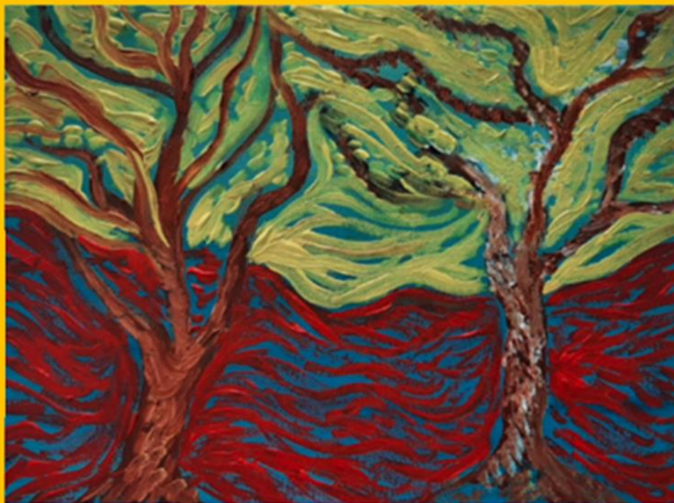
Painting by Giovanni Florido during course workshop