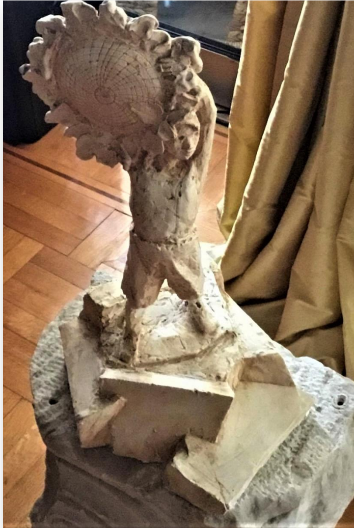
Πρόπλασμα του έργου του Διονύση Γερολυμάτου «Το αγόρι με τον ήλιο στον ώμο»