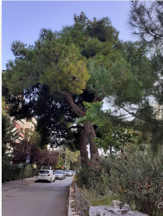
Το πεύκο του Αντώνη Σαμαράκη στο Χαλάνδρι