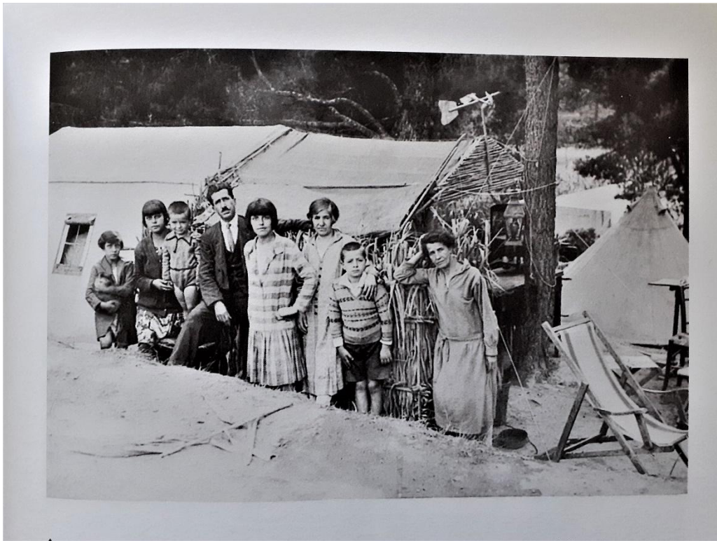
Ο Αντώνης Σαμαράκης με την οικογένειά του στο Χαλάνδρι, 1930

Στο πλαίσιο του «Έτους Σαμαράκη» και προκειμένου να τιμήσουμε και να γνωρίσουμε τον Αντώνη Σαμαράκη , προτείναμε στο Αετοπούλειο Πολιτιστικό Κέντρο του Δήμου Χαλανδρίου την πραγματοποίηση εργαστηρίου για παιδιά από 12 ετών το οποίο θα περιελάμβανε: