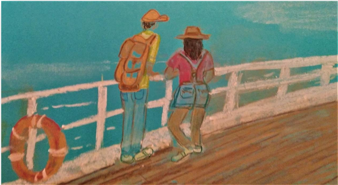
«Συνάντηση στο πλοίο»