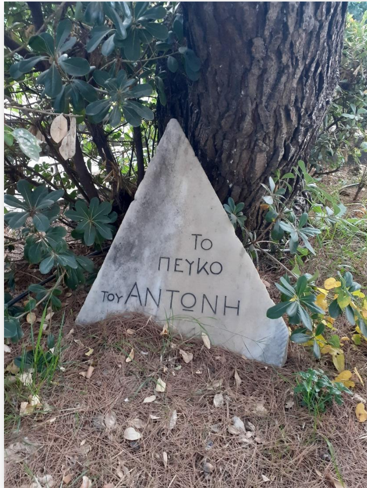
Το πεύκο του Αντώνη Σαμαράκη στο Χαλάνδρι