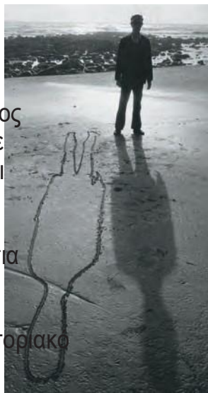
Ο Γκραγκ με το Περίγραμμα της σιάς του(εικ.1)

Ο Τόνι Γκραγκ είναι Άγγλος σύγχρονος καλλιτέχνης. Σε πολλά έργα του σχεδιάζει περιγράμματα διαφόρων μορφών και καλύπτει το εσωτερικό τους με κομμάτια από καταστραμμένα πλαστικά αντικείμενα. Το έργο του είναι πρωτοποριακό και το χαρακτηρίζει η πρωτοτυπία των υλικών που χρησιμοποιεί.